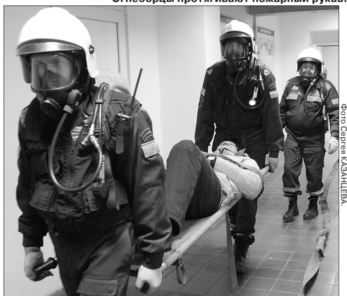
* Нижнетагильская служба спасения эвакуирует корреспондента «ТР».

Вскоре очаг возгорания был ликвидирован, а условные пострадавшие найдены и спасены.