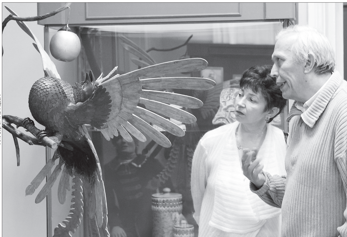
* Посетители выставки знакомятся с работами мастеров.