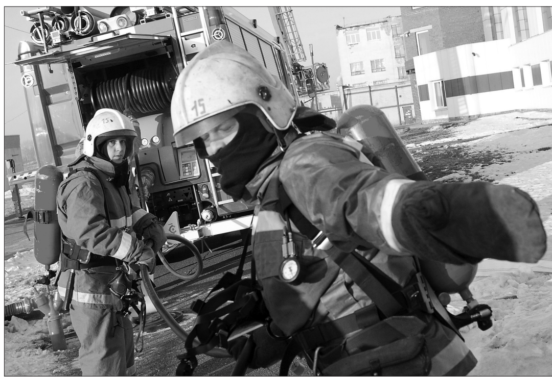
* Огнеборцы протягивают пожарный рукав.