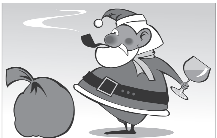
Иллюстрация Петра УПОРОВА.

Так, в преддверии зимних праздников полиция презентовала сайт «сети гостиниц» для любителей выпить и начать буйство в нетрезвом виде. На сайте «сети» сказано, что в настоящее время полиция уже начала бронирование комнат на Рождество и Новый год. Гостиам учреждения, работающего 24 часа семь дней в неделю, будут предложены одиночные камеры с интерьером в стиле «минималистский шик», возможность получить блюда, разогреть в микроволновке, а также полная изоляция на время пребывания.