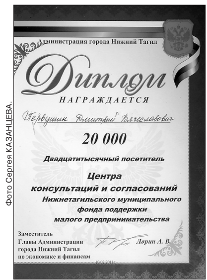
* Памятный диплом.