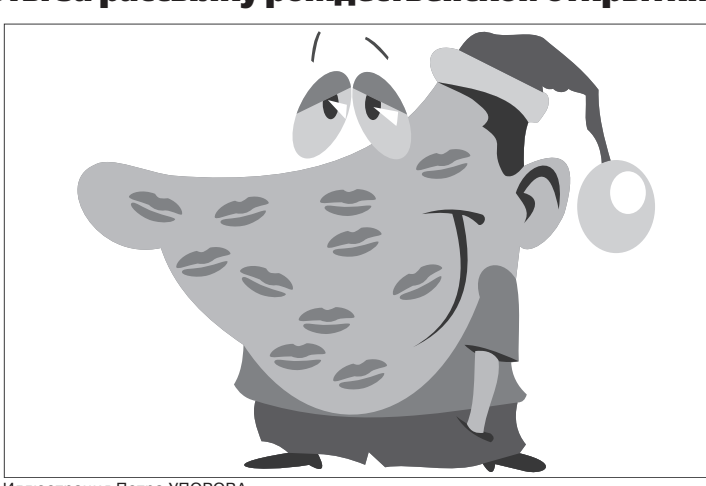
Иллюстрация Петра УПОРОВА.

прежж муниципалитета и является серьезным нарушением служебной этики. В скором времени мэр Коимбры Жоао Бар-