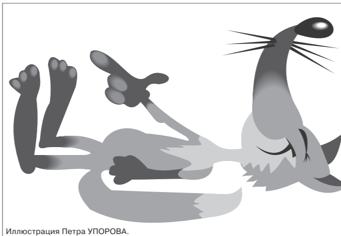
Иллюстрация Петра УПОРОВА.

В лесу неподалеку от деревни Старые Поддубы, которая расположена в Гродненской области Белоруссии, охотник получил ранение бедра и был госпитализирован.