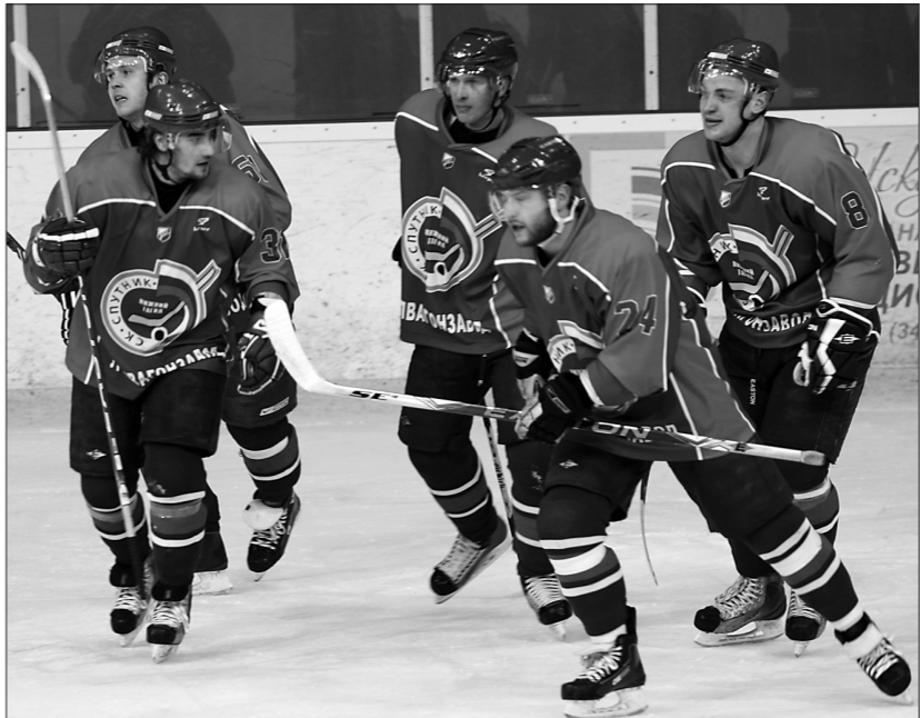
Великолепная пятерка. Хоккеисты четвертого звена забросили две шайбы.