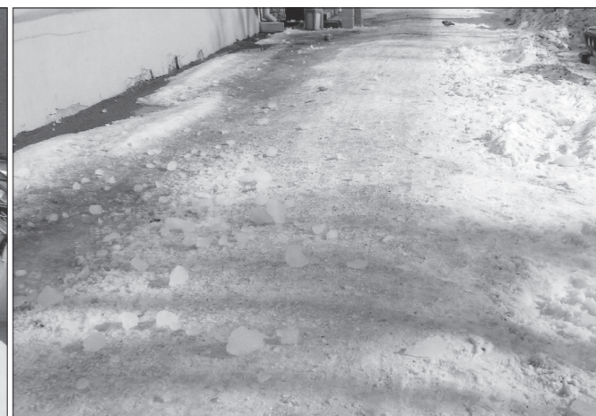
* С этого места возле водостока рухнула ледяная глыба.

Пятница, 11 марта, была счастливым днем для прохожего, оказавшегося на тротуаре возле дома по улице Карла Маркса, в котором расположена пizzeria.