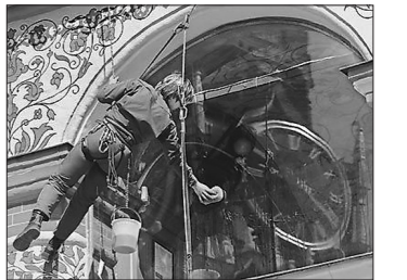
27 марта часы на Спасской башне переведут на летнее время в последний раз.

В конце этой недели, в ночь на 27 марта, часы на Спасской башне, в парадных залах и рабочих кабинетах Московского Кремля «потревожат» в последний раз.