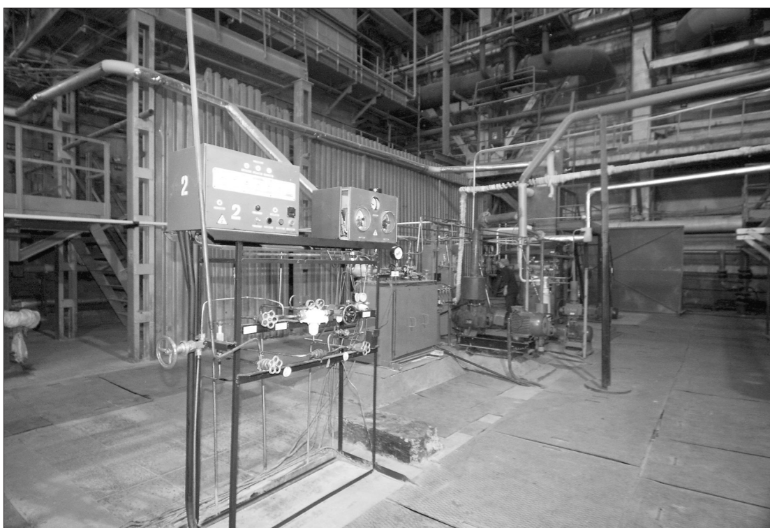
* Кислородно-компрессорное производство.