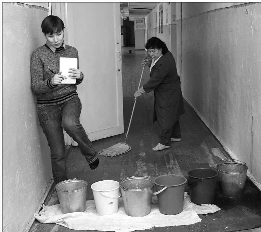
* Чтобы на полу не образовывались лужи, приходится подставлять ведра.