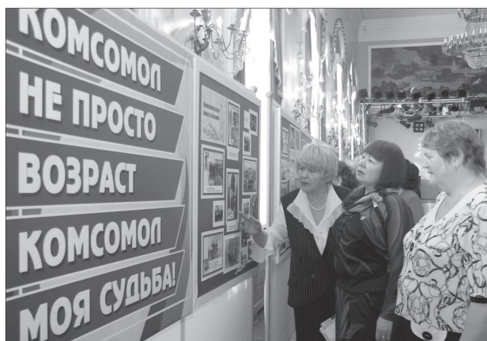
* Черно-белые снимки на стендах смотрелись ярче и эффектнее современных цветных.

черно-белых снимков, но почему-то они смотрелись ярче и эффектнее современных цветных. Почему? Комсомольцы, улыбаясь, отвечали: