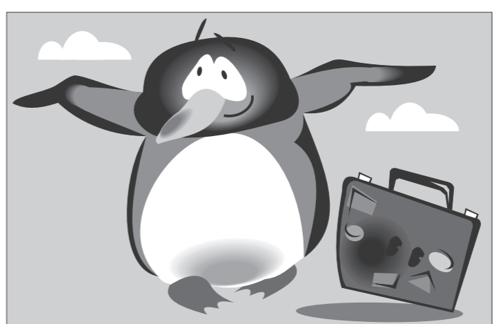
Иллюстрация Петра УПОРОВА.

Птицу приняли на борт вместе со специалистами из парка дикой природы SeaWorld, которые возили Пита в Сан-Франциско, где он участвовал в научной конференции.