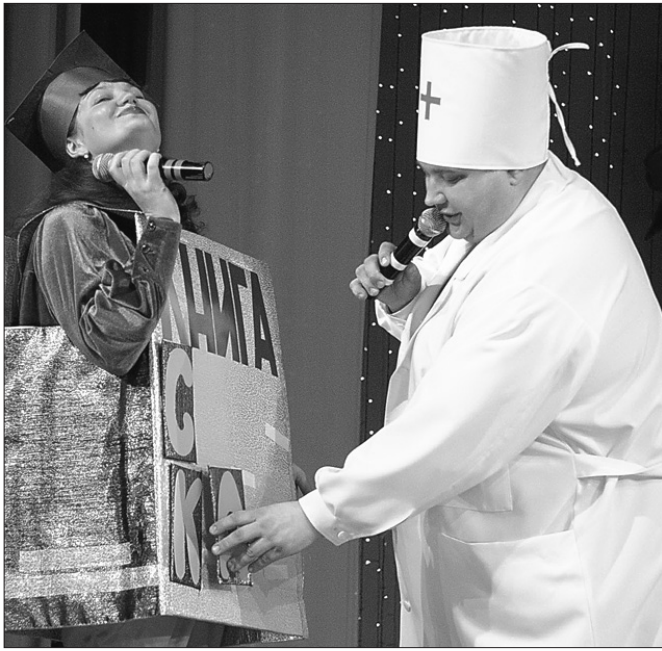
* Доктор Айболит помог найти для книги сказку букву «А».