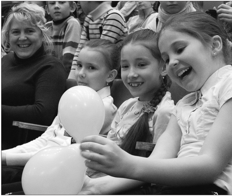
* Зрители в восторге от волшебных солнечных пилюль.

Сотни девочек и мальчишек, их родители и педагоги собрались в большом зале городского Дворца детского и юношеского творчества на праздник, посвященный Неделе книги. Организованный сотрудниками центральной городской библиотеки, он стал подарком для самых активных юных читателей.