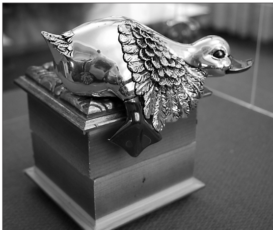
* Талисман конкурса – серебряная утка.

Завершился пятый городской открытый конкурс детского творчества «Серая Шейка», посвященный уральскому писателю Д.Н. Мамину-Сибиряку. 205 юных авторов представили на суд жюри 224 работы в четырех номинациях: «Проза», «Сказка», «Сочинения разных жанров», «Медиапроекты». Подведены итоги, вручены призы.