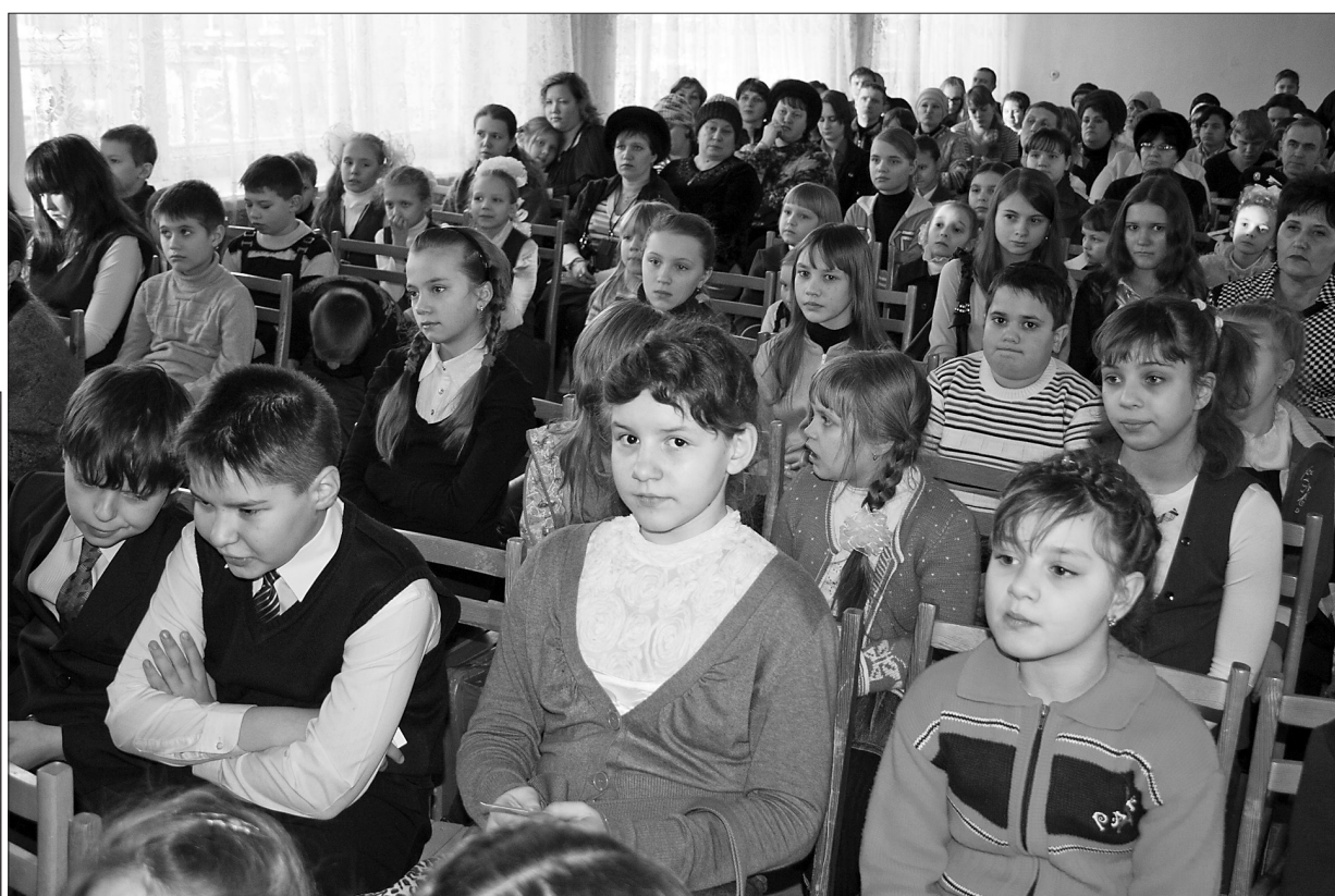
* Участники и лауреаты пятого конкурса «Серая Шейка».