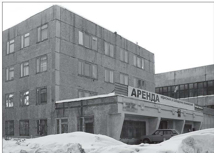
* Тагильский молочный завод.