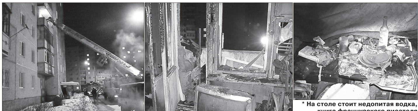
* Пожарные проникают по лестнице в квартиру.