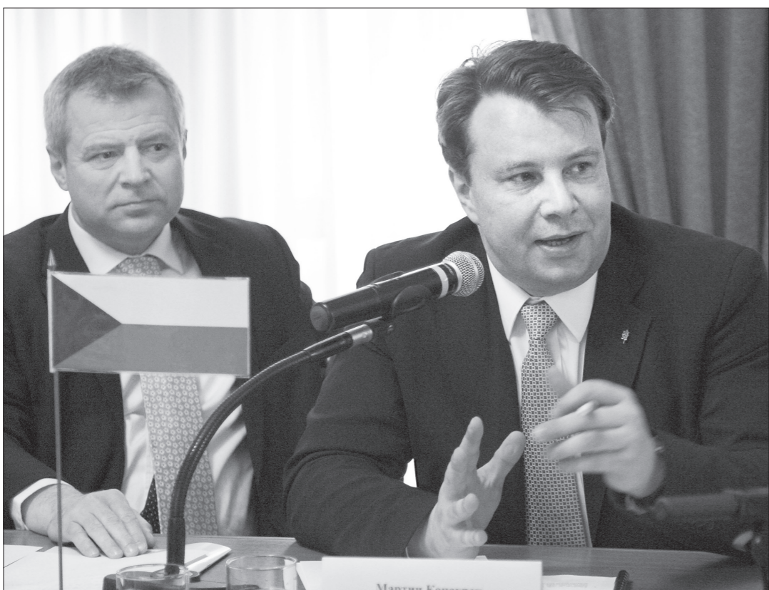
* Министр промышленности и торговли Чешской Республики Мартин Коцюрек и чрезвычайный и полномочный посол Чехии в Российской Федерации Петр Коларж.

Большая делегация из Чешской Республики побывала позавчера в Нижнем Тагиле. В ее состав вошли министр промышленности и торговли Мартин Коцюрек, посол Чехии в Российской Федерации Петр Коларж, генеральный консул ЧР в Екатеринбурге Мирослав Рамеш, чешские бизнесмены и промышленники.