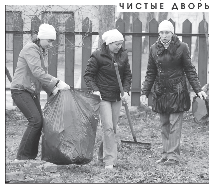
* Сейчас здесь убирают мусор, а в мае посадят цветы.

РОДНОМУ ГОРОДУ – КРАСИВЫЕ УЛИЦЫ, ЧИСТЫЕ ДВОРЫ