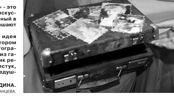
Людила ПОГОДИНА.

Приметы несовершеннолетней Малковой Е.А.: рост около 155 см, худощавого телосложения, лицо овальное, волосы русые, ложенные, лицо овальное, волосы русые, уши прилегающие. Была одета: куртка розового цвета на молнии (материал - плащевка), спортивные брюки черного цвета, по бокам три желтые полоски, футболка розового цвета, обувь в кроссовки черного цвета.