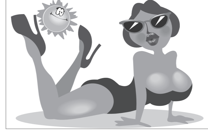
Иллюстрация Петра УГОРОВА.