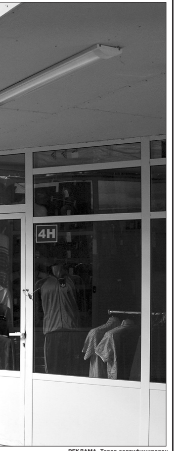
РЕКЛАМА. Товар сертифицирован.