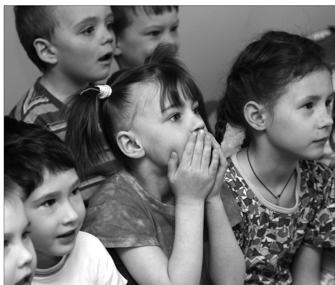
Малыши из «Улыбки» — самая благодарная публика.

Увидев нарисованную пальму на ширме в своем игровом зале, малыши реабилитационного центра «Улыбка» захлопали в ладоши, повторяя: «Театр, театр, театр». А когда на эту пальму прилетел попугай, девочки и мальчики ни капельки не удивились, что он говорящий, и стали с готовностью отвечать на его вопросы. Так в рамках «Весенней недели добра» в центре прошел благотворительный спектакль театра для детей «Парус».