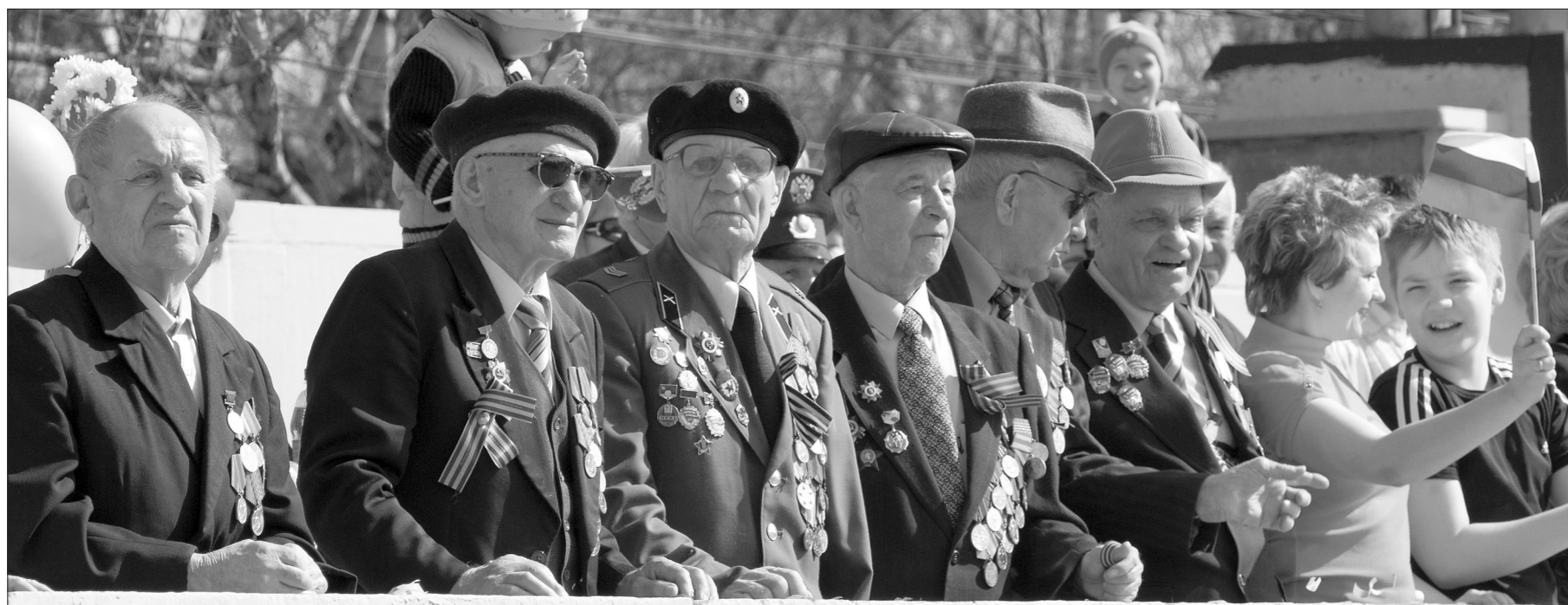
* На трибуне - ветераны.