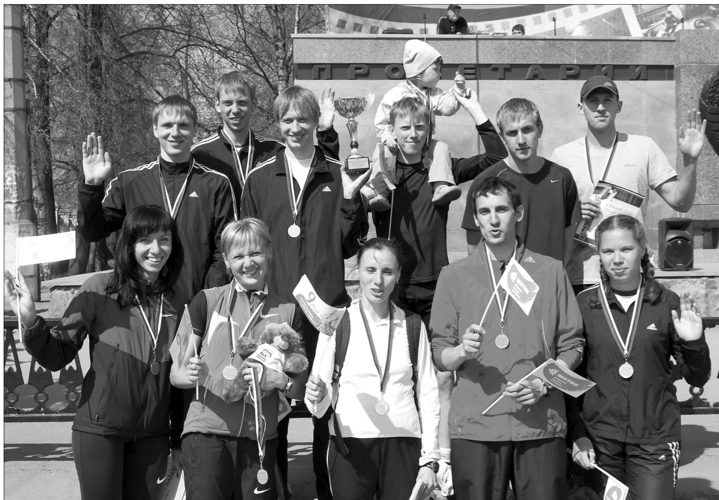
Команда чемпионов. В нижнем ряду первая слева — чемпионка Европы и мира Мария Савинова.