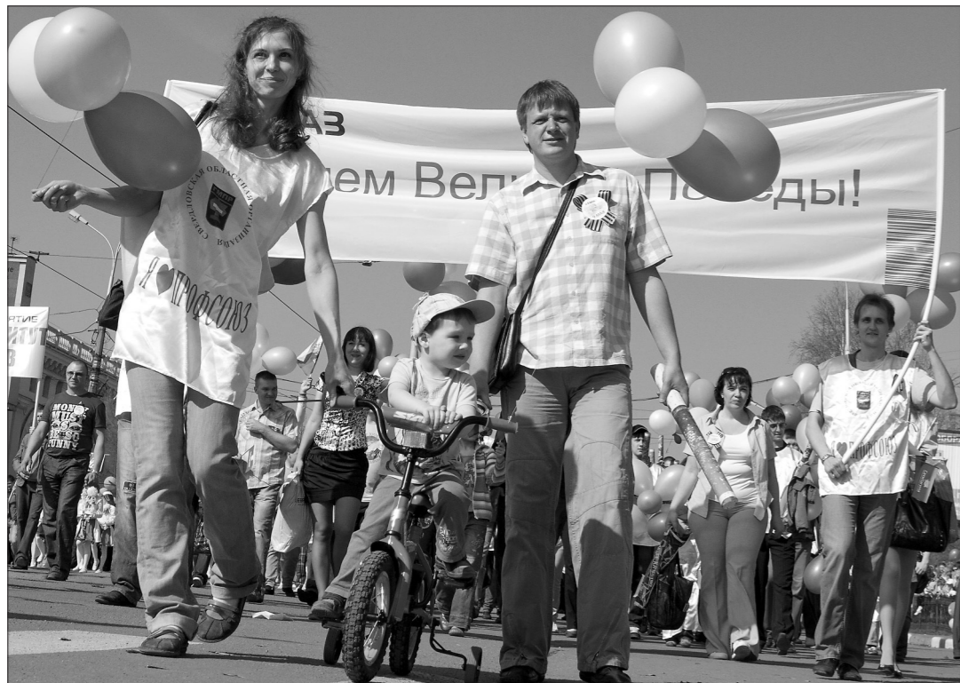
* В праздничных колоннах тагильчан.