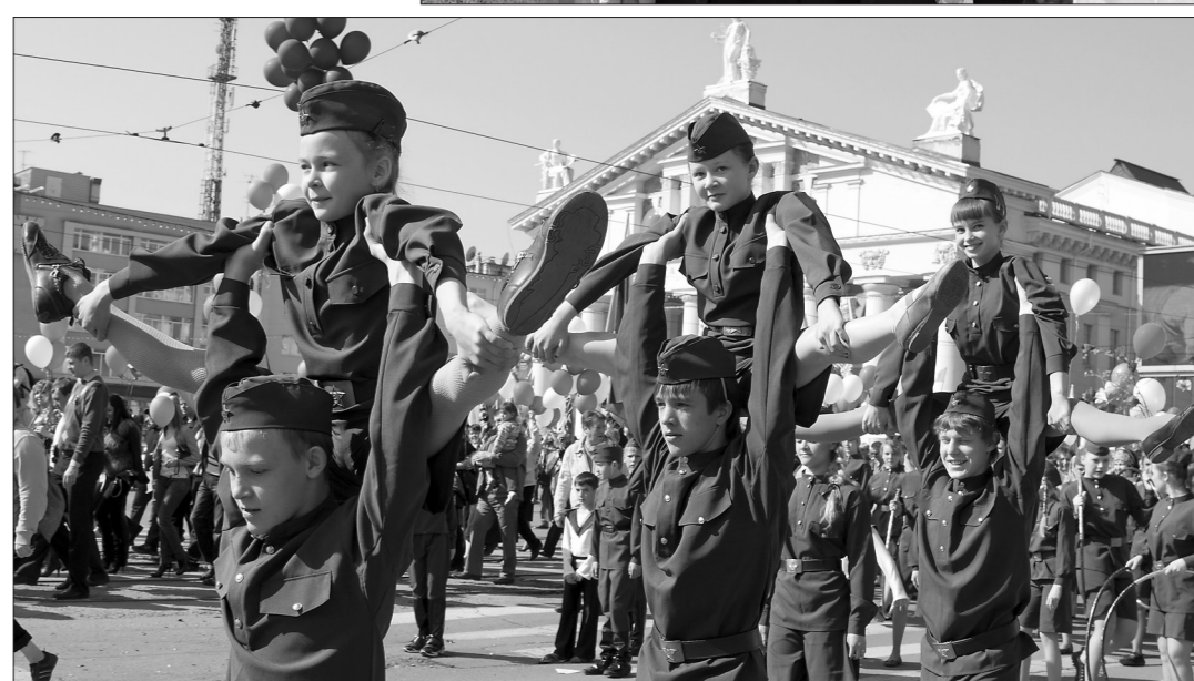
* Театрализованное представление.