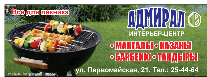
ул. Первомайская, 21. Тел.: 25-44-64

В этом магазине покупателям предлагается и другая удобная в обращении утварь для приготовления пищи на открытом воздухе, которая может также украсить загородный дом, беседу, веранду. Это мангалы, шампуры, грили, казаны, печи барбекю, вертикальные шашлычницы, тандыры и т.д.