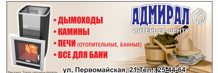
ул. Первомайская, 21. Тел.: 25-44-64