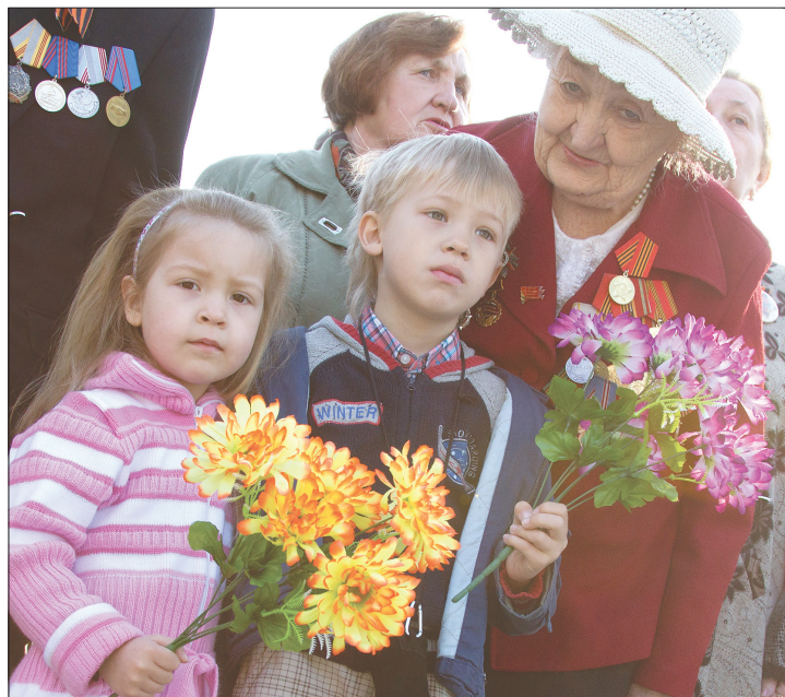
* На торжественный митинг на мемориале кладбища «Центральное» ветераны приехали вместе с внуками.