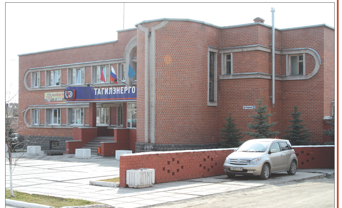
На обслуживании МУП «Тагилэнерго» находится 32 котельных, 306 км тепловых сетей, 52 насосные станции. Задачи предприятия определены в уставе: теплоснабжение жилищного фонда, предприятия и организаций города, эксплуатация, строительство и ремонт объектов теплоэнергетического комплекса. Численность коллектива предприятия – более 1150 человек.

ул. Черных, 16. Тел.: 24-08-38, 24-63-38.