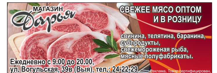
ул. Вогульская, 39В (Выя), тел.: 24-22-29