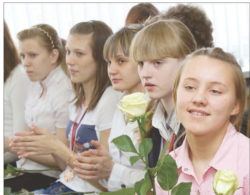
*...и их ближайший резерв из команды «Старый соболь-95».

Таких достижений в женском баскетболе у нас еще не было, и вместе с «Тагильчанкой» молодые баскетболистки также присутствовали на приеме, как и мужская команда «Старый соболь». В Высшей лиге чемпионата России она заняла нынче 11-е место среди 18 команд, представлявших зачастую областные и краевые центры.