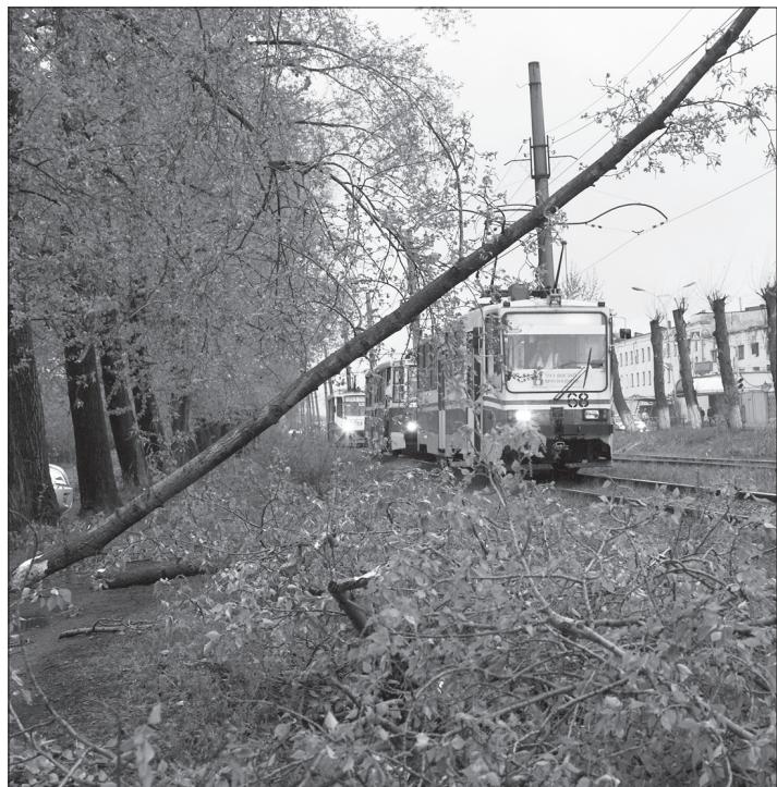
* Деревья валились на контактные провода и пути.