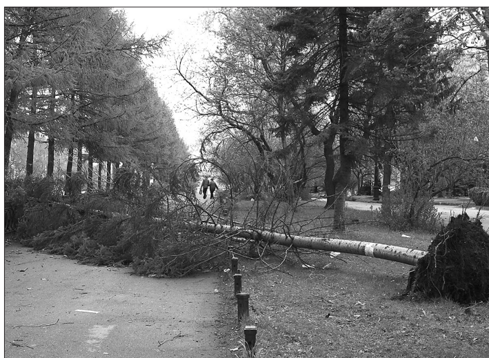
Аллея возле общественно-политического центра.