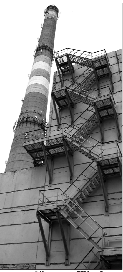
* Котельная ГТМ работает как самостоятельная ТЭЦ.