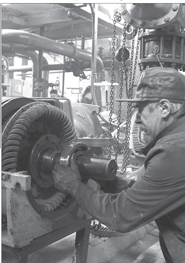
* Ремонтируется оборудование на котельной №4.

Заметные преобразования происходят в котельной ГГМ на Черноисточинском шоссе. Работает котельная как самостоятельная ТЭЦ, в автоматическом режиме, по локальной схеме: сколько пара выработает турбогенератор, столько и электроэнергии получим на мощ-