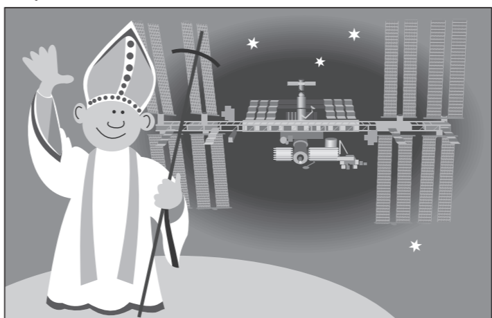
Иллюстрация Петра УПОРОВА.

Папа Римский Бенедикт XVI провел беседу с космонавтами, находящимися на Международной космической станции, сообщает Associated Press.