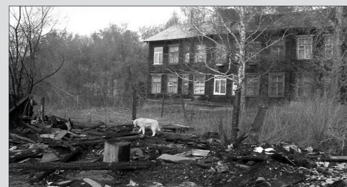
* Сгоревшие сараи расположены вблизи жилых деревянных домов.

В связи с нарастающей тревогой населения инициативная группа жителей готовит обращение в разные инстанции с просьбой помочь очистить Старатель от сожженных строений. Поддержка нужна по разным направлениям: юридическая, чтобы обосновать правомочность сноса, организационная, чтобы привлечь технику. Также необходимо рассмотреть во-