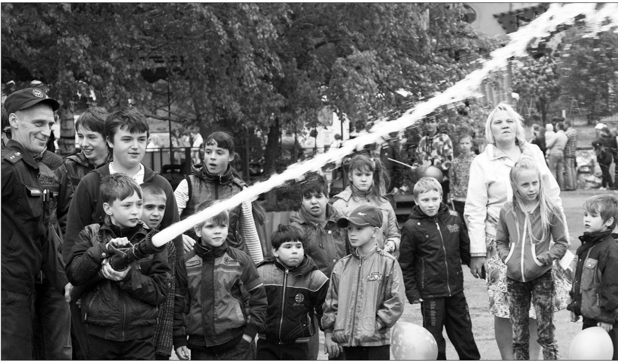
* Непросто сбить шарик со стойки струей воды.