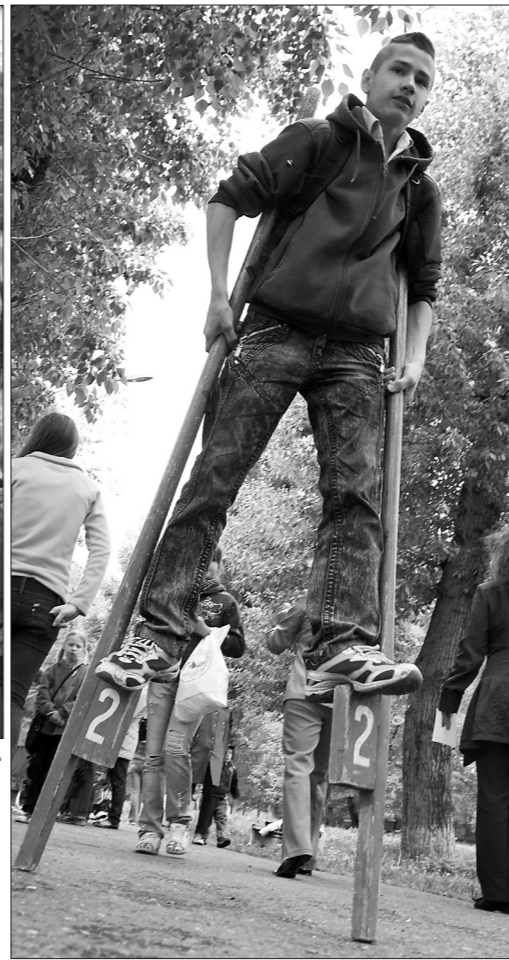
* По парку - на ходулях.