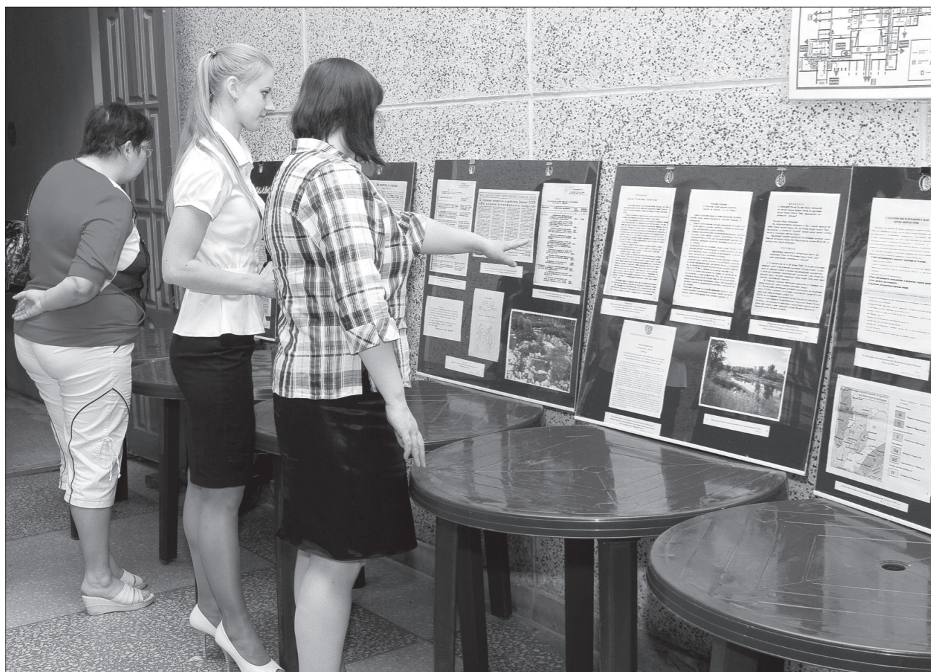
Выставка архивных материалов.