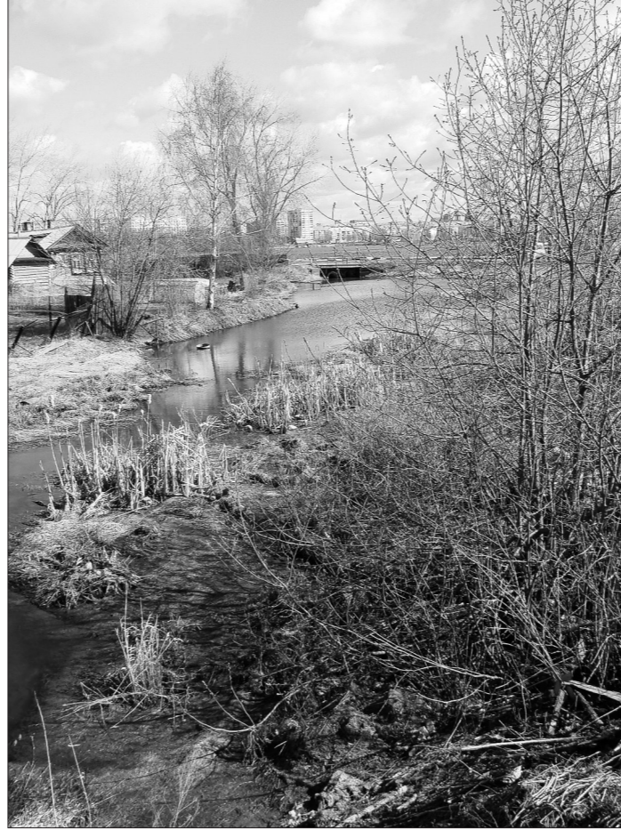
Устье реки Гальянки.