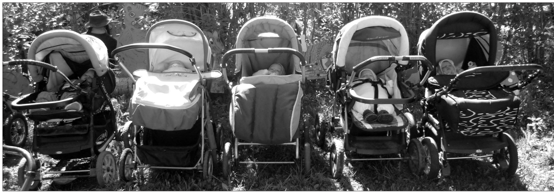
Совсем крохи.