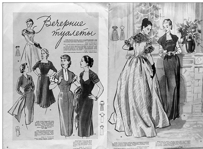
Страницы модного журнала прошлых лет.