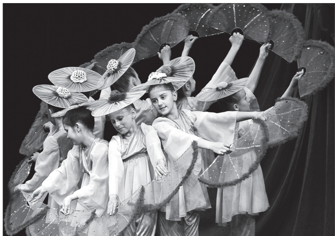
Выступает ансамбль «Вдохновение».