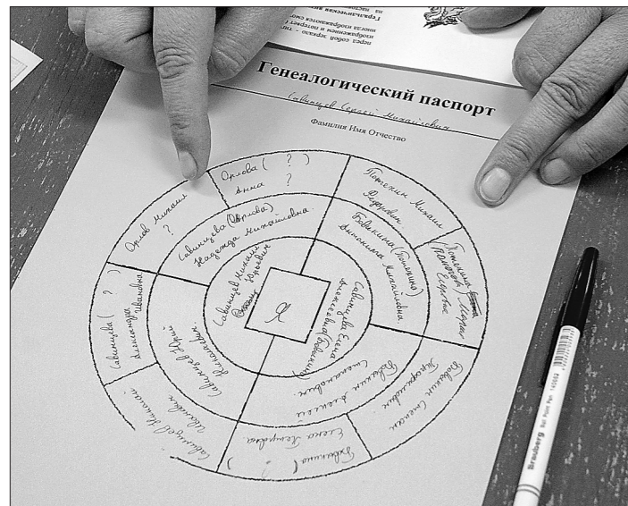
Вариант генеалогического паспорта.