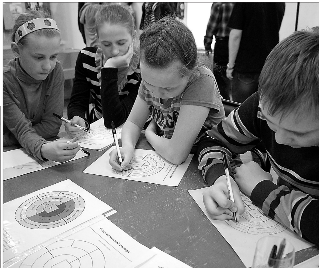
Юные тагильчане учатся составлять свою родословную.