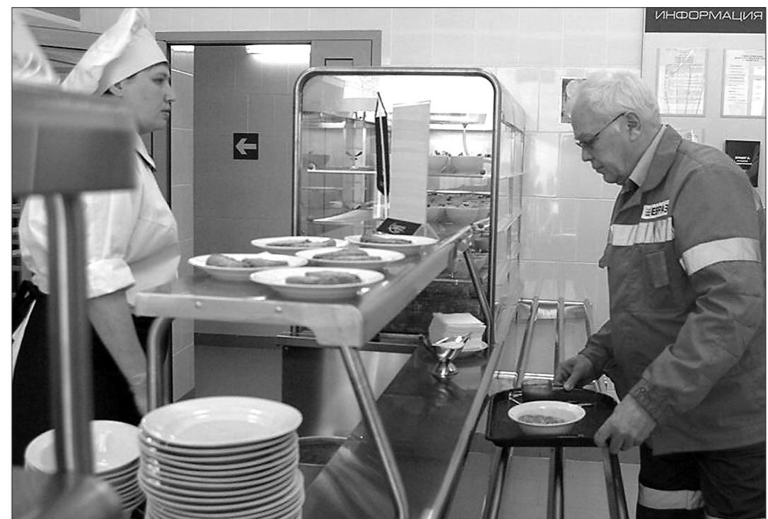
В столовой.

На ВГОКе, в Высокогорском обогатительном цехе, состоялось торжественное открытие столовой после капитального ремонта.