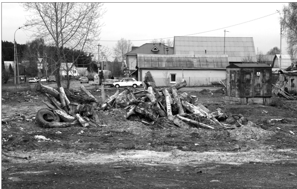
Старый дом разобрали, а убрать забыли?