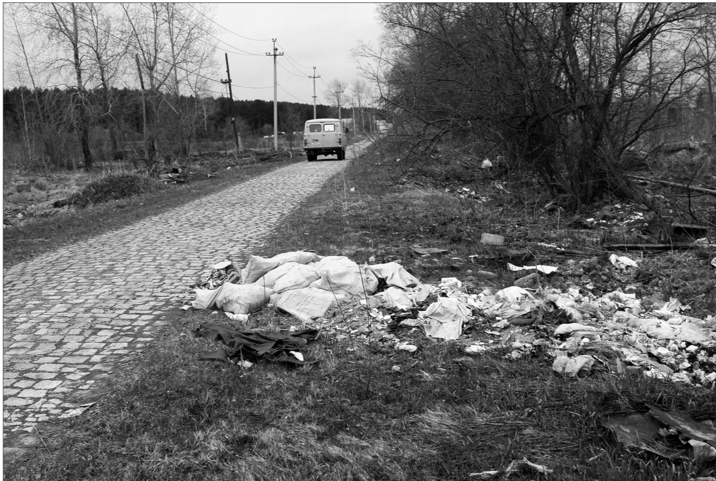
«Рублевская» мусорка захватывает все новые площади.