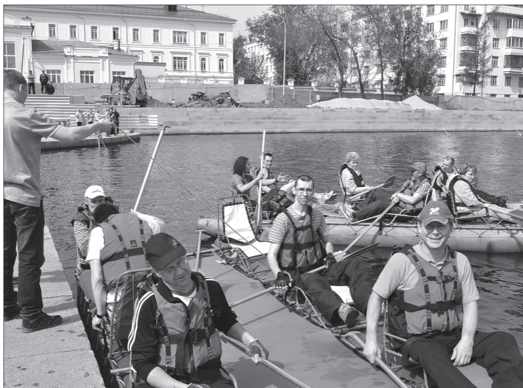
Команда Нижнего Тагила заняла первое место в гонках на катамаранах, второе и третье места в личном зачете «полоса препятствий».

В Екатеринбурге прошел фестиваль для людей с ограниченными возможностями «Майский экстрим».