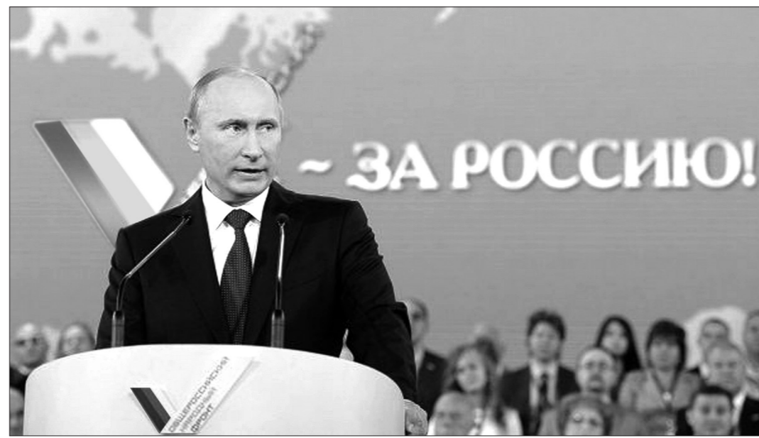
Выступает Владимир Путин.

«Очень бы хотелось, чтобы народ имел возможность требовать и от главы государства, и от главы самого маленького населенного пункта и поселка выполнения своих обязательств, власть