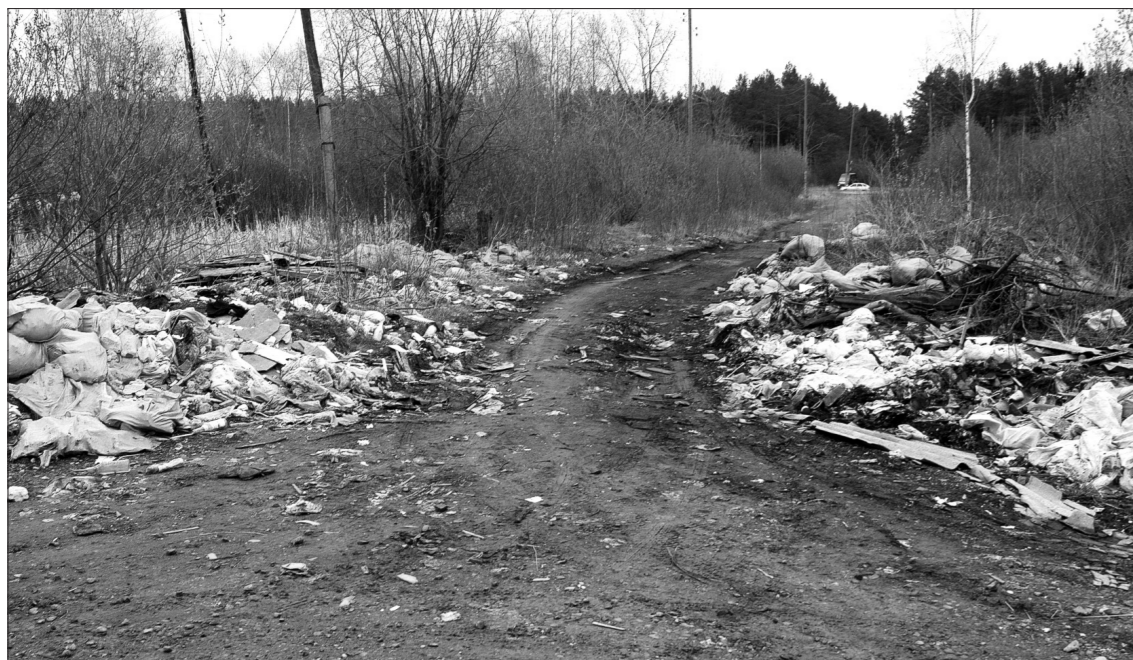
В связи с ремонтом дороги машины вынуждены ездить прямо по свалке.