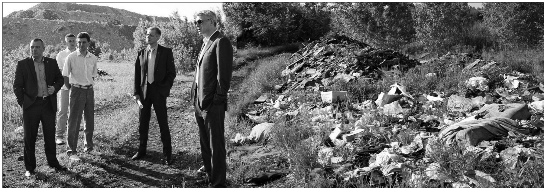
Свалки на торфянике.

На окраинах города немало мест, которые бессовестные граждане превращают в филиалы мусорного полигона. Только вот отходы, в том числе опасные, на таких «полигонах» никто не утилизирует – периодически их расчищают за счет муниципалитета. С каждым годом нелегальный мусорный вал растет, растут и расходы на ликвидацию. Глава города Сергей Носов побывал на нескольких стихийных свалках, расположенных на территории Ленинского района.