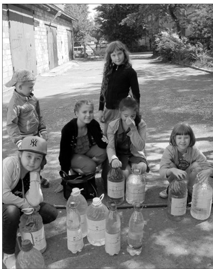
Родниковая вода для ветеранов.

В канун Дня России ребята из экологического объединения «Зеленая волна» приняли участие в добрых делах, посвященных этому празднику. Их организаторами педагоги городской станции юннат.