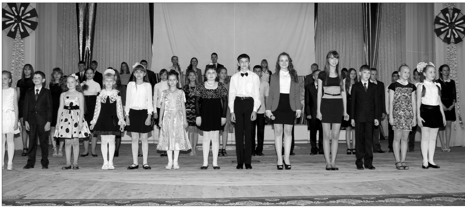
Лучшие из лучших.