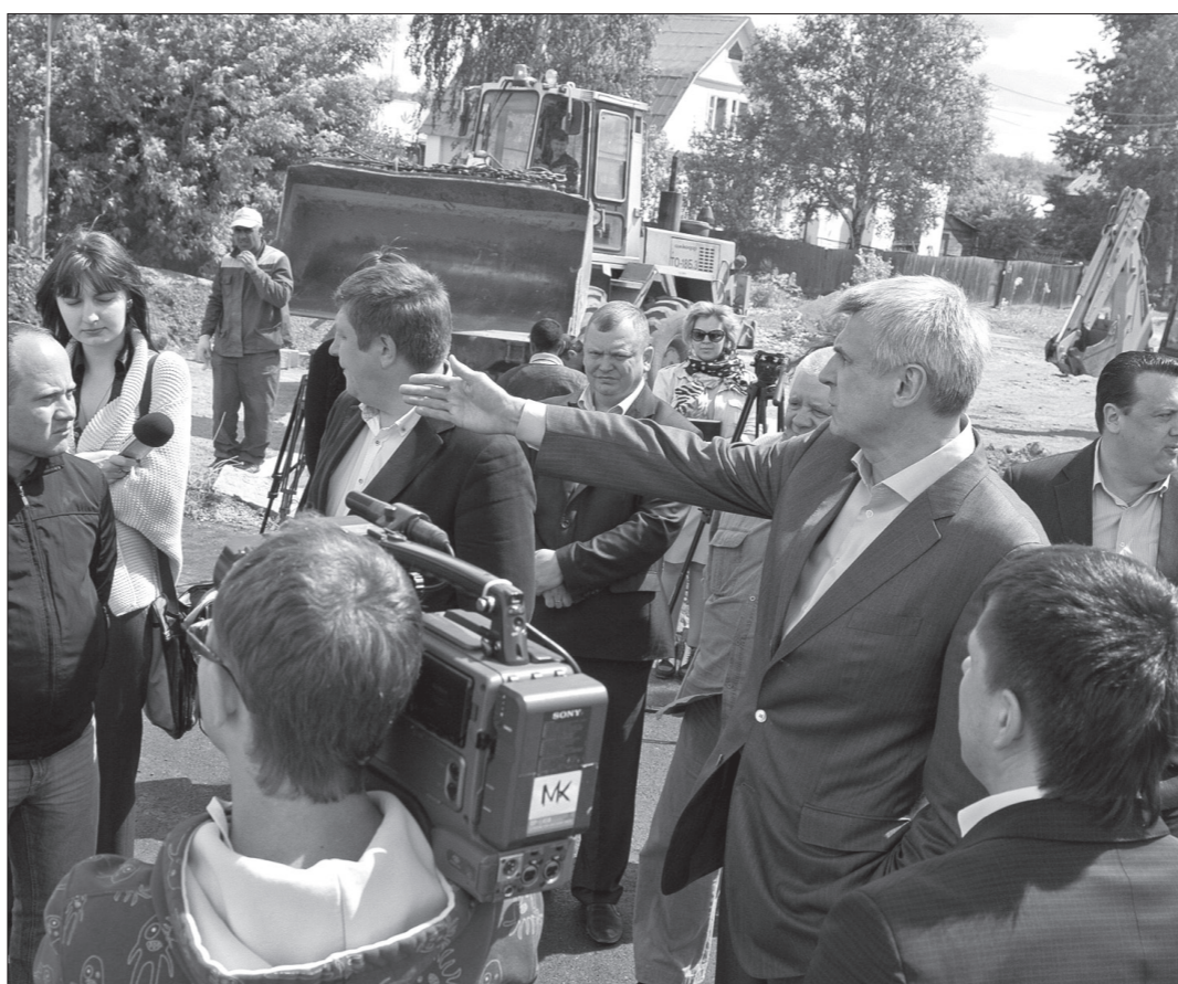
На завершающем этапе ремонта дорожного полотна на улице Кулибина глава города проводит оперативное совещание.

Пять человек погибли и семь - получили травмы, в том числе один ребенок, в семи дорожно-транспортных происшествиях, которые произошли в пятницу, 14 июня. Как сообщили в ГИБДД Нижнего Тагила, обстановка на дорогах в этот день носила чрезвычайный характер.