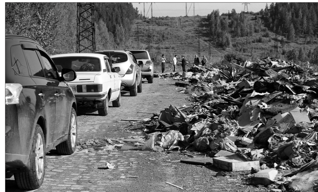
Дорога на Верхнюю Черемшанку.

Но, чем дальше отъезжаешь от кладбища по улице Трудовой, тем чаще попадаются на пути мусорные кучи. И совсем уж беспредельная, почти километровая свалка протянулась вдоль дороги от горы Долгой в сторону Верхней Черемшанки. Горы