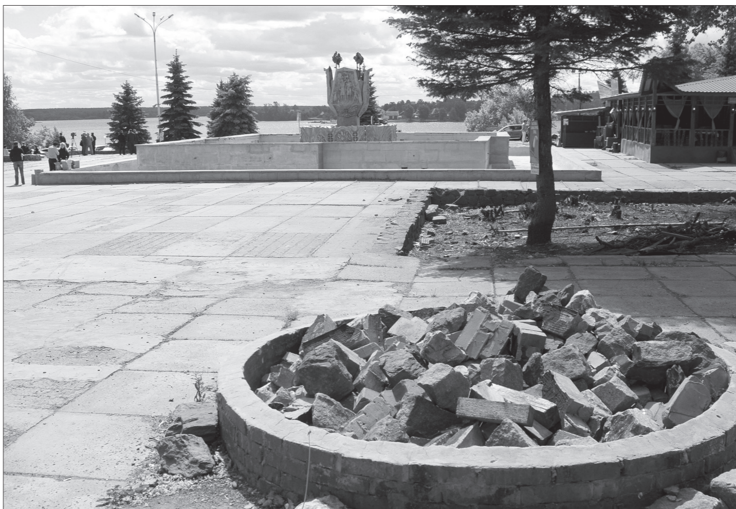
Фонтан «Каменный цветок» значительно изменится.

Началась реконструкция спуска от Театральной площади к набережной Тагильского пруда. В пятницу территорию огородили забором, а в понедельник рабочие приступили к демонтажу старой облицовки многоступенчатой лестницы.