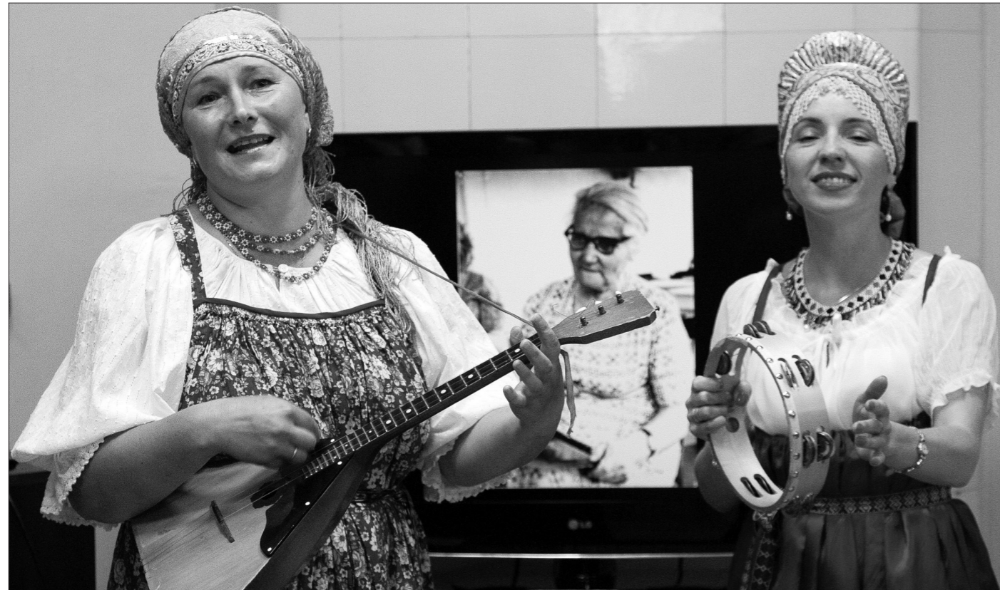
Выступает «Соловейко», а на экране – портрет Агриппины Афанасьевой.