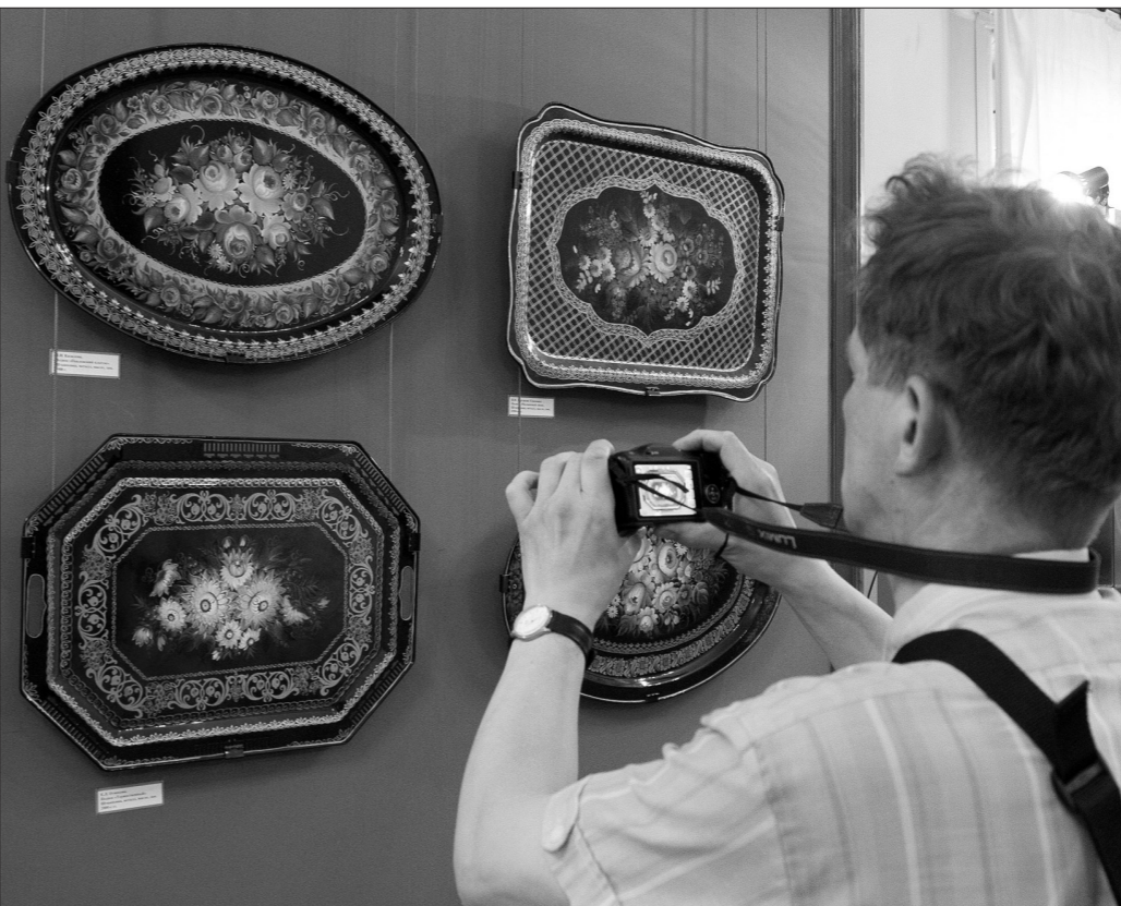
Первые посетители выставки.