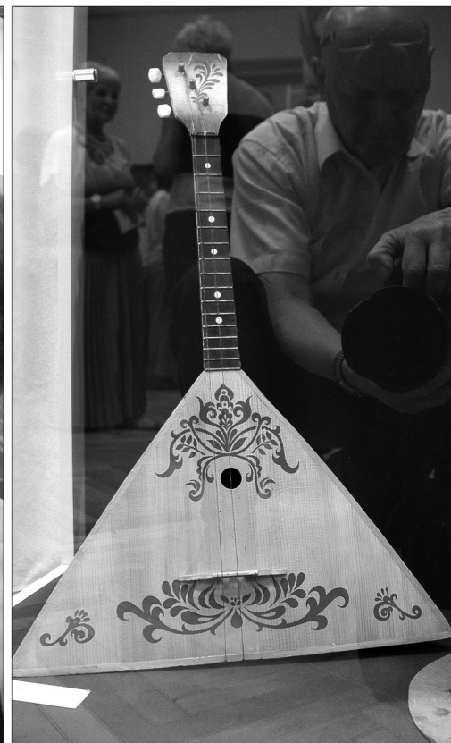
Балалайка тети Груши.