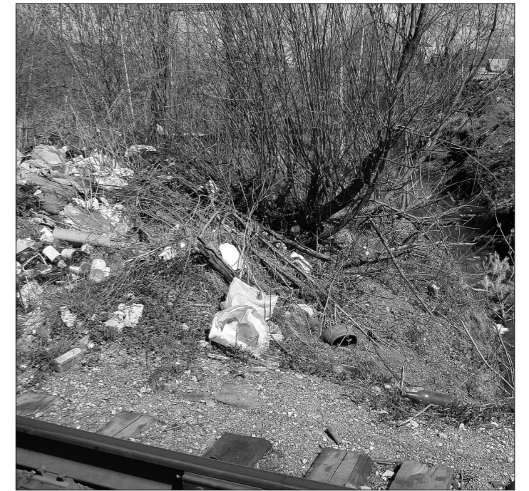
Рудянка. Свалка у реки.

В начале улицы Мало-Рудянской на северном берегу реки находилось кладбище, а в устье реки – небольшой пруд. Название речка получила от Меднорудя-