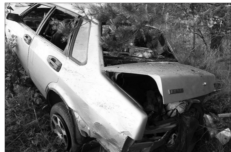
Так выглядела 99-я после аварии.

Во вторник, 18 июня, в половине пятого часа утра, на 15-м километре автодороги Башкарка – Новопаншино (ближе к деревне Марково) не справился с управлением водитель «Жигулей» 99-й модели, 26-летний житель Нижнего Тагила.