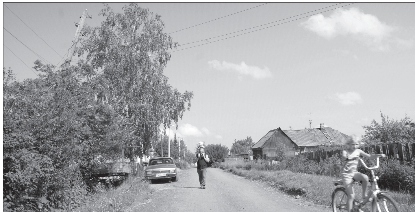
Велосипедистка Света Таранченко одна из первых оценила преображенную улицу Керченскую.

К сожалению, так удачно начатая работа внезапно