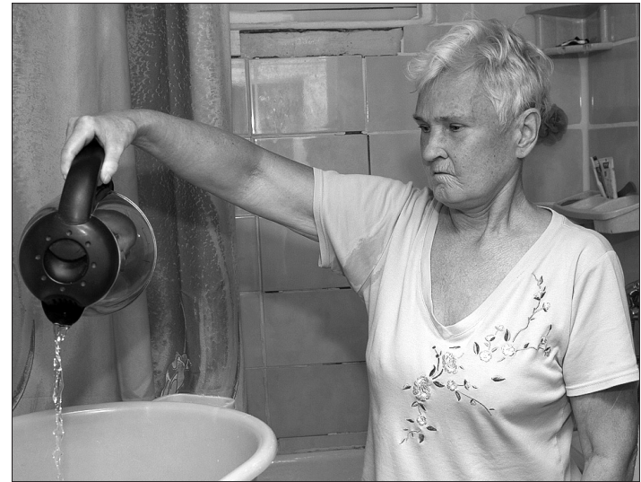
Весь месяц жительница дома №20 по ул. К. Маркса ходит в ванную с горячим чайником.

Женщина такая перспектива расстроила. Вести хозяйство в аварийном режиме ей тяжело: муж - инвалид, взрослый сын - тяжелый инвалид, требующий особого ухода.