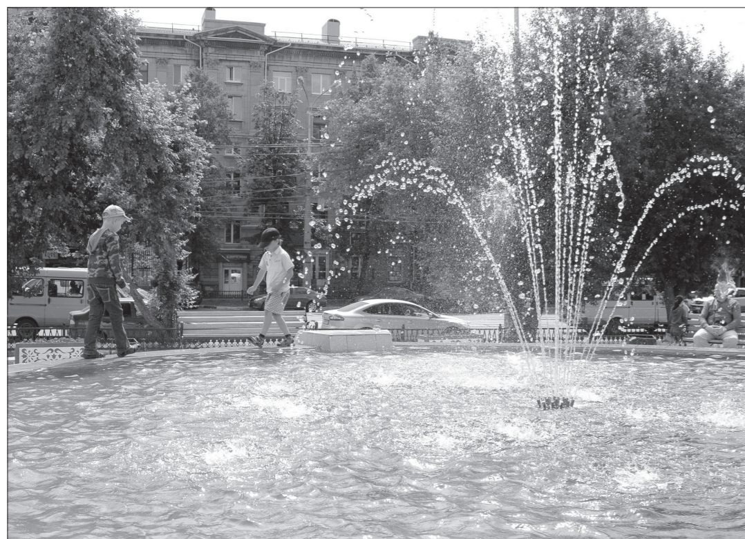
Запустили фонтан на проспекте Ленина.

Нет прохожих, которые не замедлили бы шаг, оказавшись напротив дома №46 по проспекту Ленина. Несколько дней назад здесь ожил фонтан, а вместе с ним и этот, довольно безлюдный по будням, городской уголок. Визжащие от восторга ребятишки бегают вокруг чаши с водой, радуются журчанию сверкающих на солнце потоков.