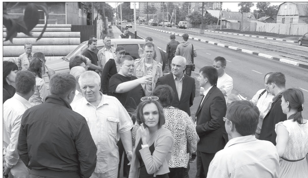
На улице Кулибина собрались общественники, специалисты, чиновники, журналисты.

Никогда еще на улице Кулибина не было так многолюдно, как в эту среду днем: оценить результаты капитального ремонта собрались представители общественности, руководители и специалисты городской администрации, подрядных организаций. Да и сама улица никогда так не выглядела: кроме объемных работ на автодороге и трамвайных путях, о которых «ТР» рассказывал ранее, выполнено благоустройство тротуаров, остановок транспорта, разбиты новые газоны. Параллельно с двигающейся вдоль дороги комиссией по обновленному участку шоссе даже прошла поливальная машина.