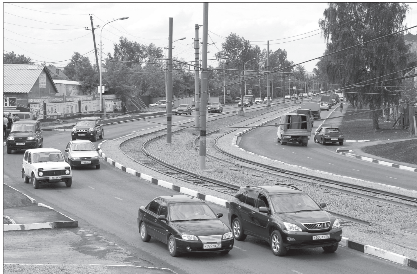
На обновленном участке трамвайная линия и тротуары отделены от шоссе, что удобно всем участникам движения.