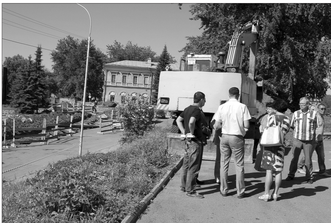
Совещание на площадке возле музея природы.