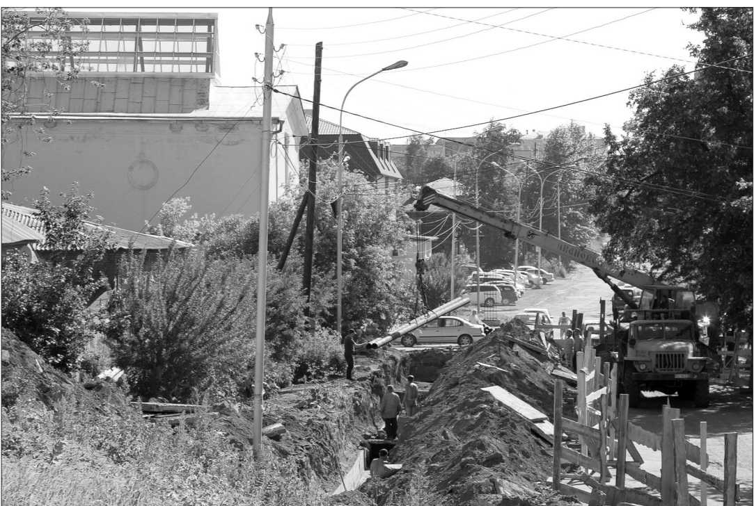
Так выглядела дорога между двумя музеями – краеведческим и изобразительных искусств.

Тагильчане, решившие утром во вторник прогуляться в историческом центре города, рядом с музеем изобразительных искусств, провиантскими складами и историко-краеведческим музеем, испытали легкий шок: дороги перерывы, вход в учреждения культуры и парк культуры и отдыха имени А.П. Бондина забаррикадирован, а над колоннами музея природы и охраны окружающей среды висит ковш экскаватора.