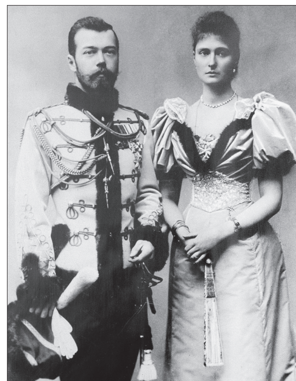
Великий князь Николай Александрович с невестой, 1894 год.