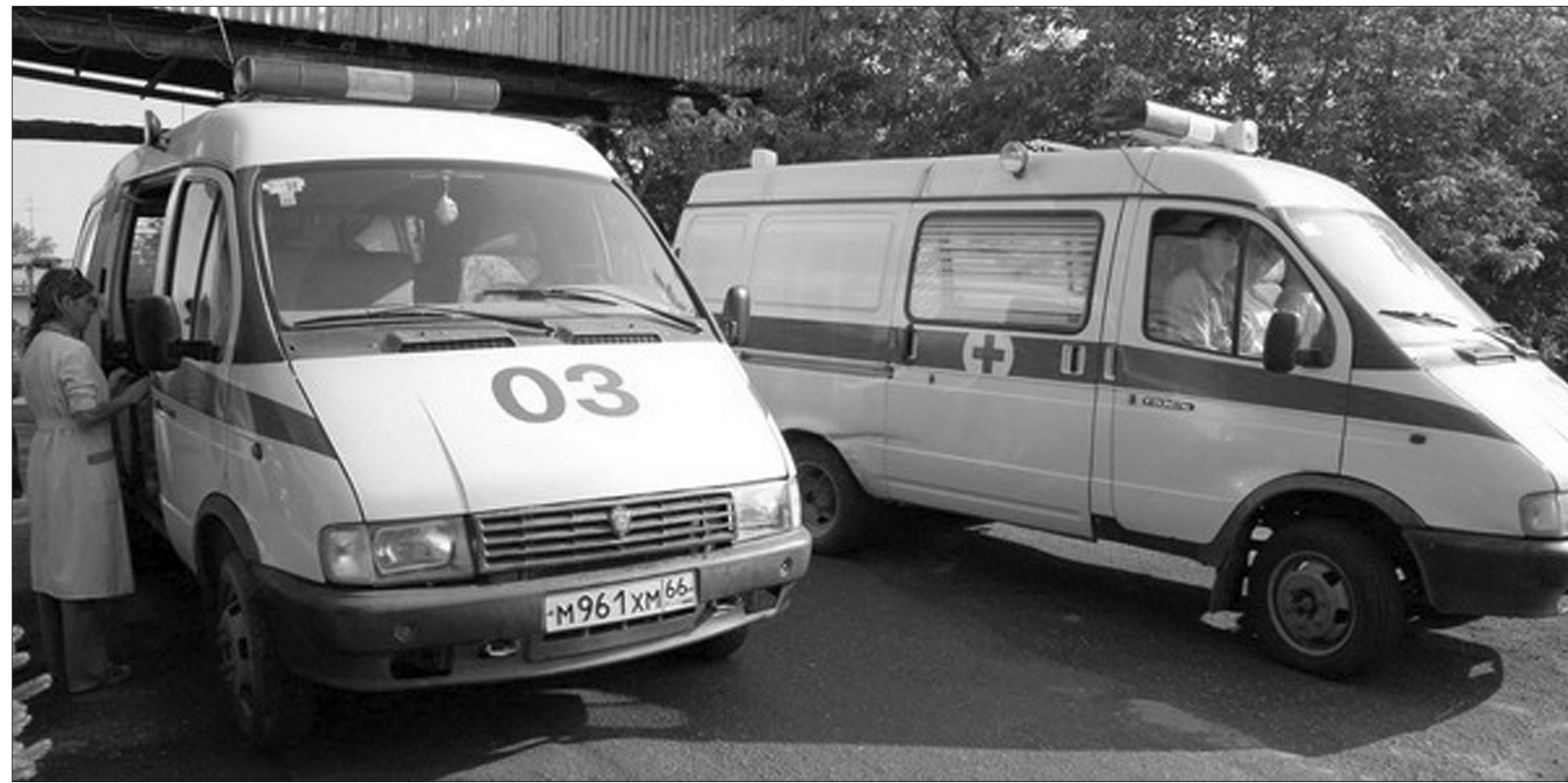
Только специалисты разберутся, у пострадавшего обморок или сердечный приступ.

В первую очередь, нужно освободить шею, чтобы ничто не сдавливало ее. Попросить любящего вас человека разойтись, дать возможность для поступления воздуха: обеспечить человеку достаточный приток кислорода, – консультирует терапевт Марина Чемлева. – Уложить пострадавшего и приподнять ему ноги. Это то, что может сделать практически любой человек. Затем обязательно вызвать «скорую»: только