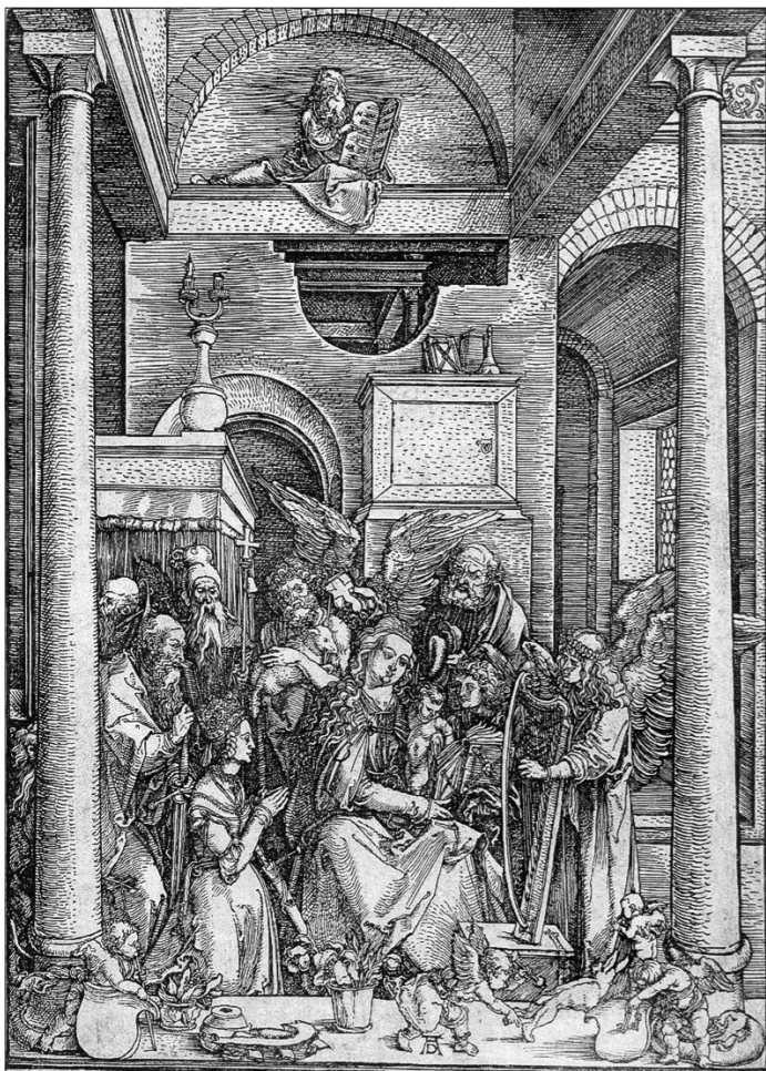
«Прославление девы Марии» Альбрехта Дюрера.