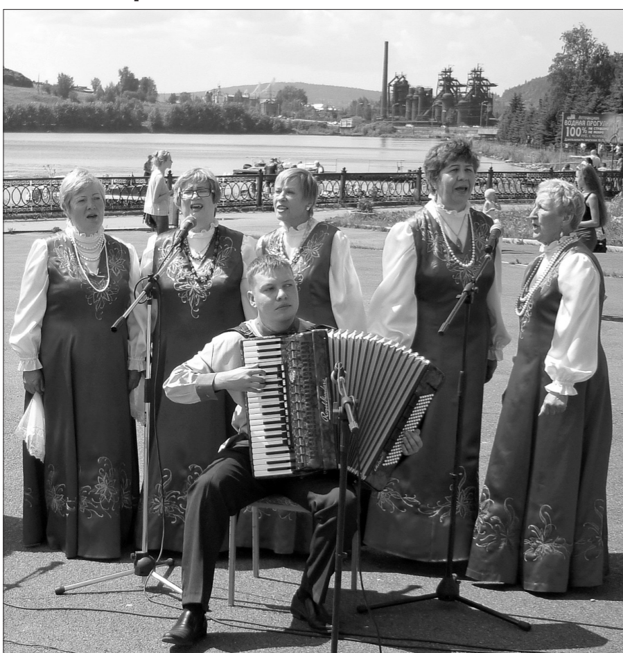
Выступают «Тагильские россыпи».

Летом, особенно в жаркую погоду, совершенно не хочется сидеть дома. Для того, чтобы хорошо провести время вместе со своими близкими, достаточно просто сходить в городской парк. Например, в воскресенье, 7 июля, в парке имени А.П. Бондина проходила праздничная программа, посвященная Дню семьи, любви и верности.