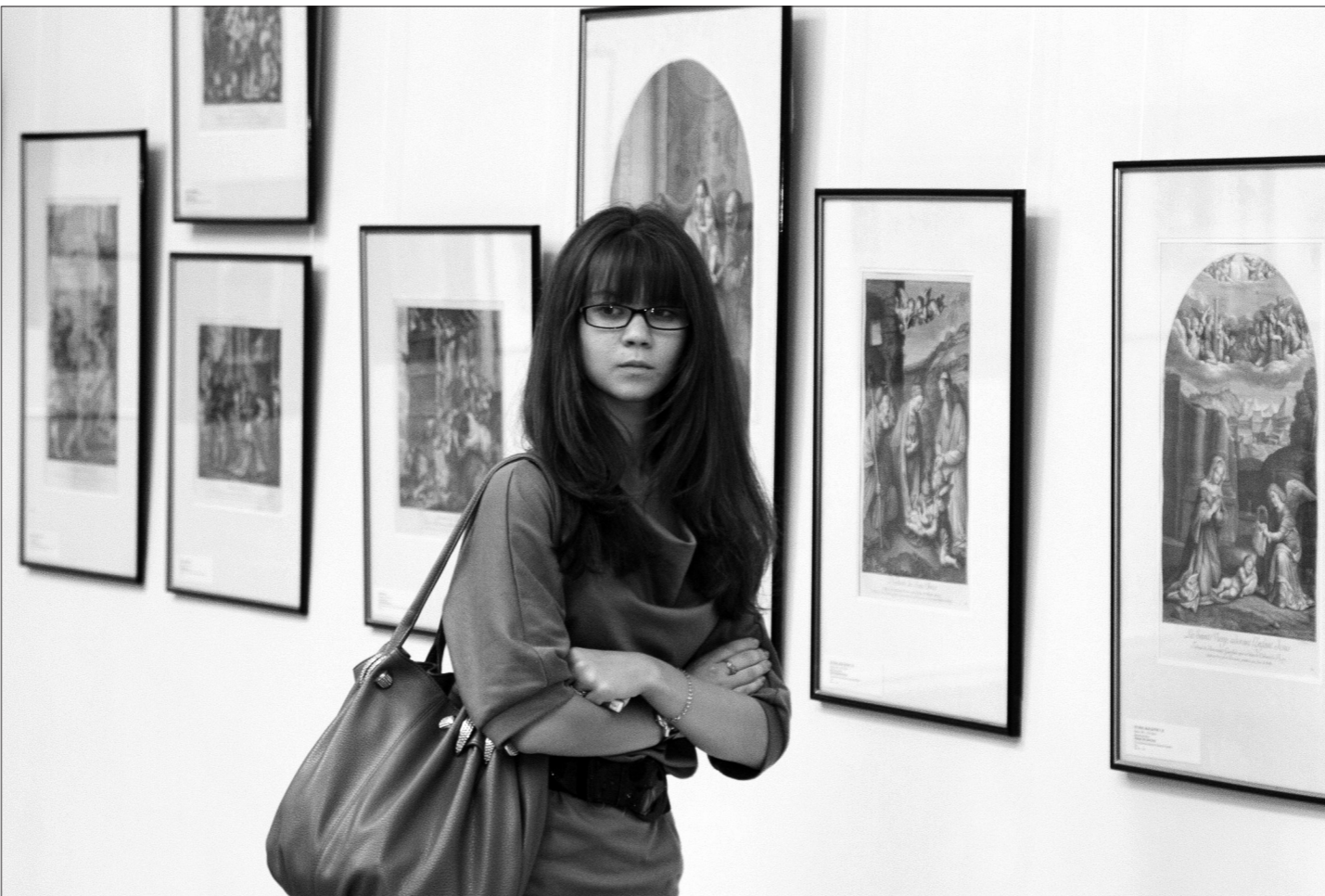
Одна из первых посетительниц выставки.