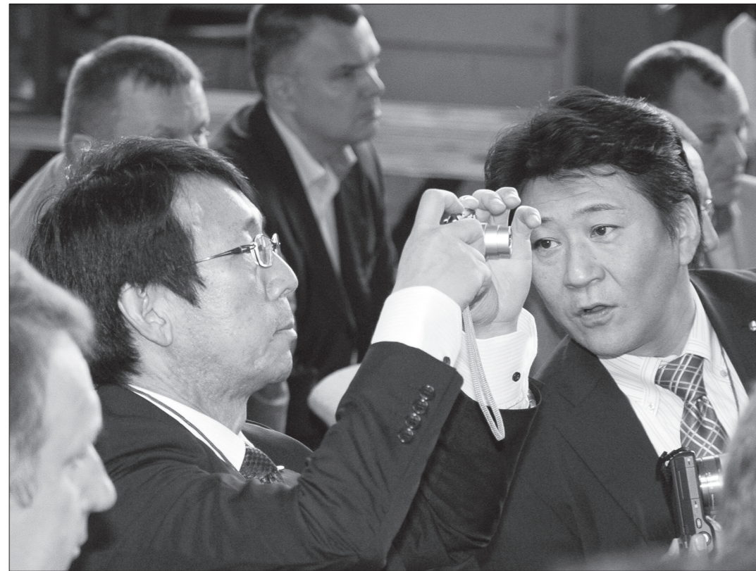
Представители японской стороны.

Татьяна ШАРЫГИНА.