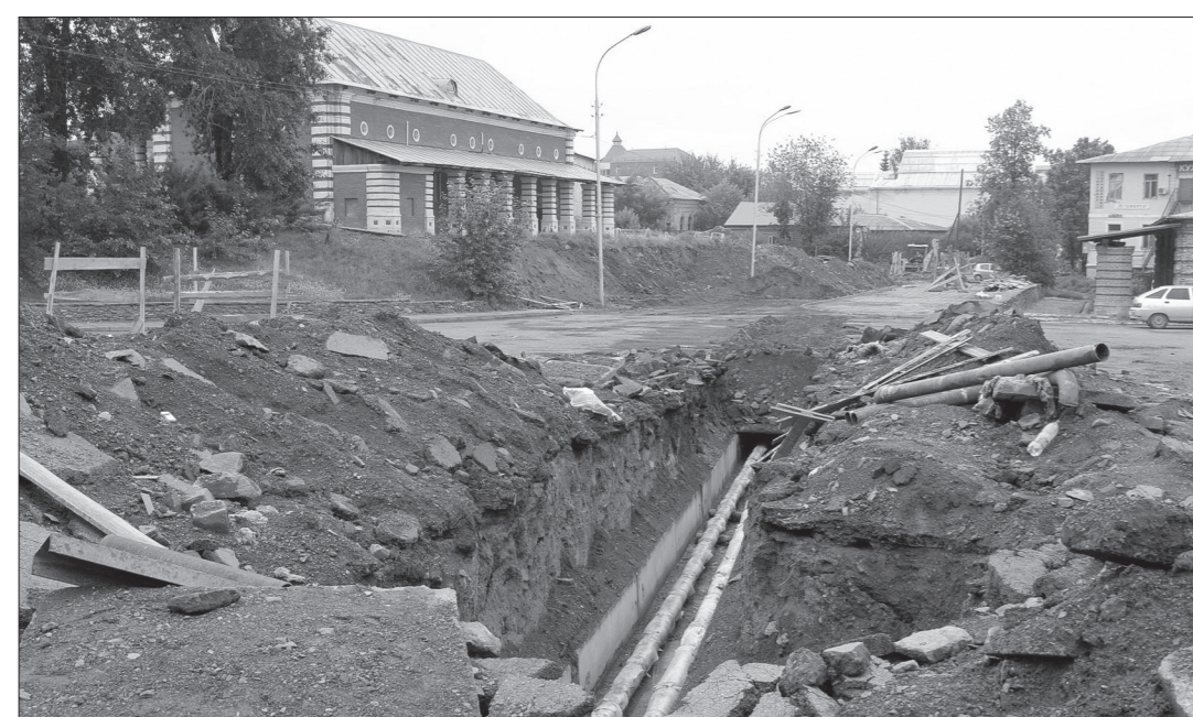
На время ремонтных работ улица Уральская стала похожа на поле боя.