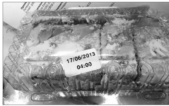
Злополуное пирожное.

Возможно, что-то напутали на производстве, нарушили технологию приготовления, может быть, продукт неправильно хранился, - прокомментировала ситуацию ведущий специалист-эксперт Ирина Олеговна Кузьмина. - Вполне вероятно, что или производитель, или продавец «играет» с датами выпуска продукции. Это когда продукт изготовлен, к примеру, 15-го числа текущего месяца, а на него ставят 17-е число, таким образом искусственно наращивается срок хранения. Так нередко поступают непорядочные производители. Однако доказать подмену даты изготовления очень сложно. Да и проверки надзорные ведомства, по закону, могут проводить теперь раз в три года. Раньше они проводились ежемесячно. Сейчас нужно быть предельно внимательными при выборе продуктов.