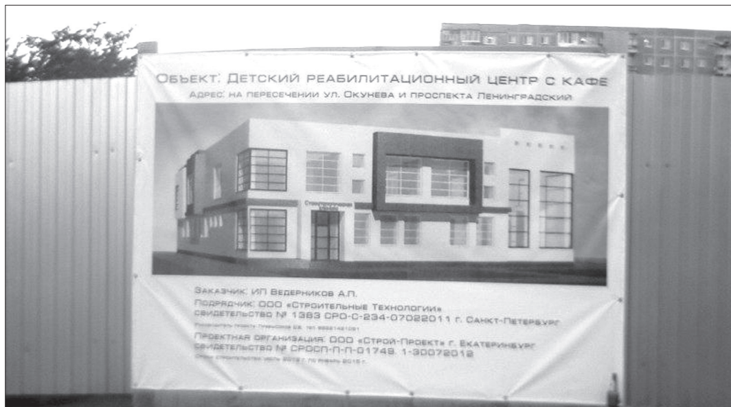
Фото автора с балкона ближайшей 9-этажки.

Вопрос мы переадресовали в управление архитектуры и градостроительства, где одна из специалистов