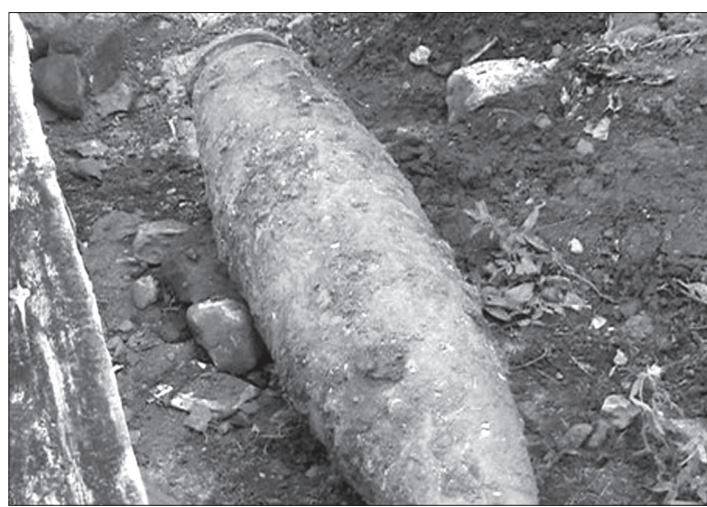
Старый, ржавый снаряд внешне выглядит угрожающе.