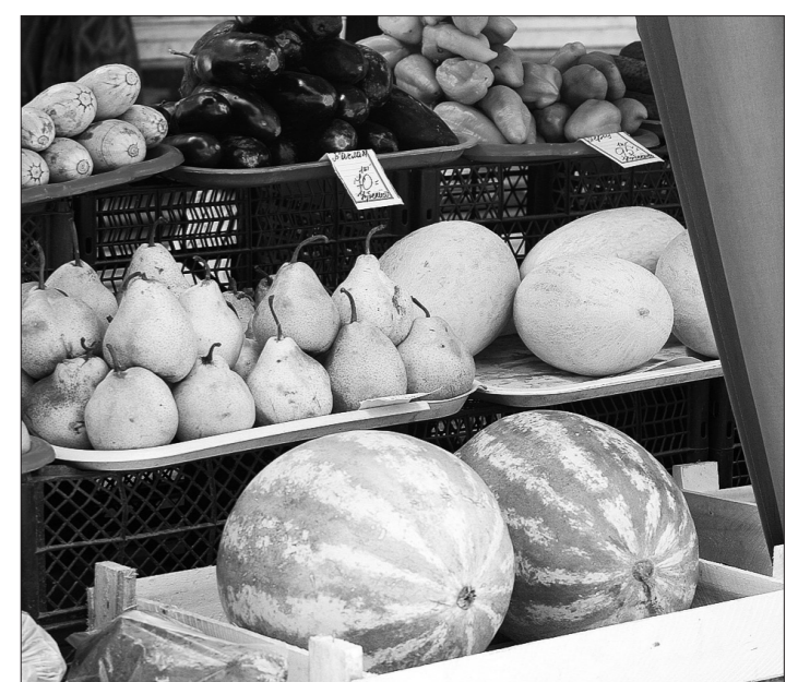
Выбор арбузов пока невелик...