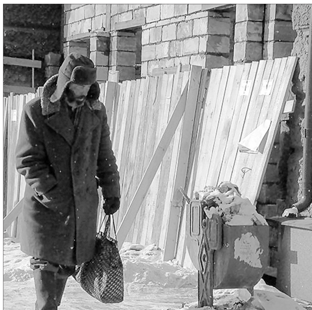
Без дома, без пищи, без семьи...

В народе ходит легенда о том, что алкоголь согревает. Это неправда - алкоголь приглушает ощущение.