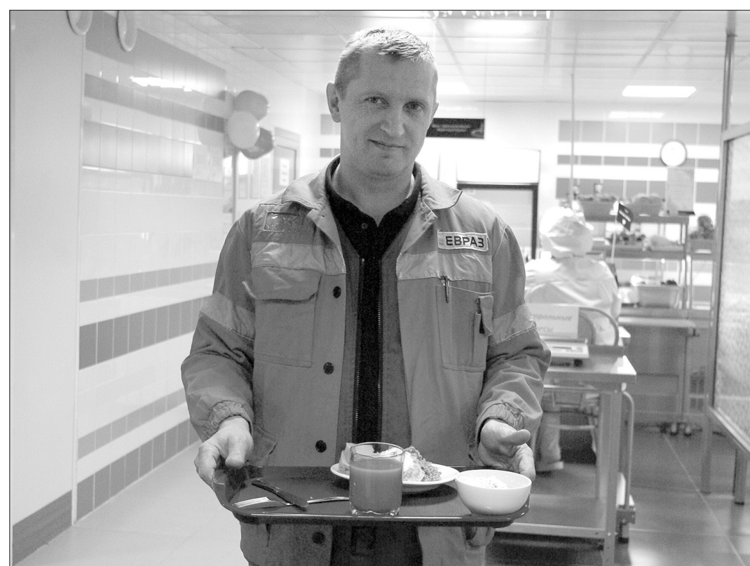
В новой столовой.