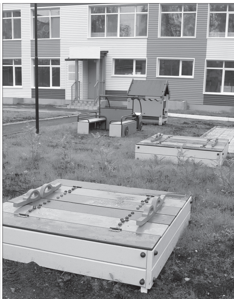
Детские площадки готовы принять малышей.