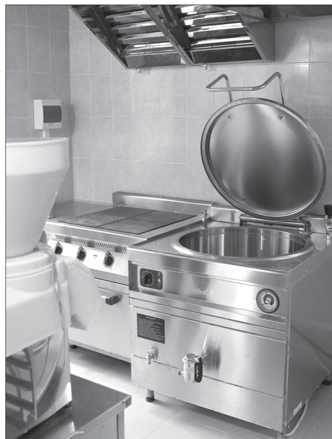
На кухне - современное оборудование.