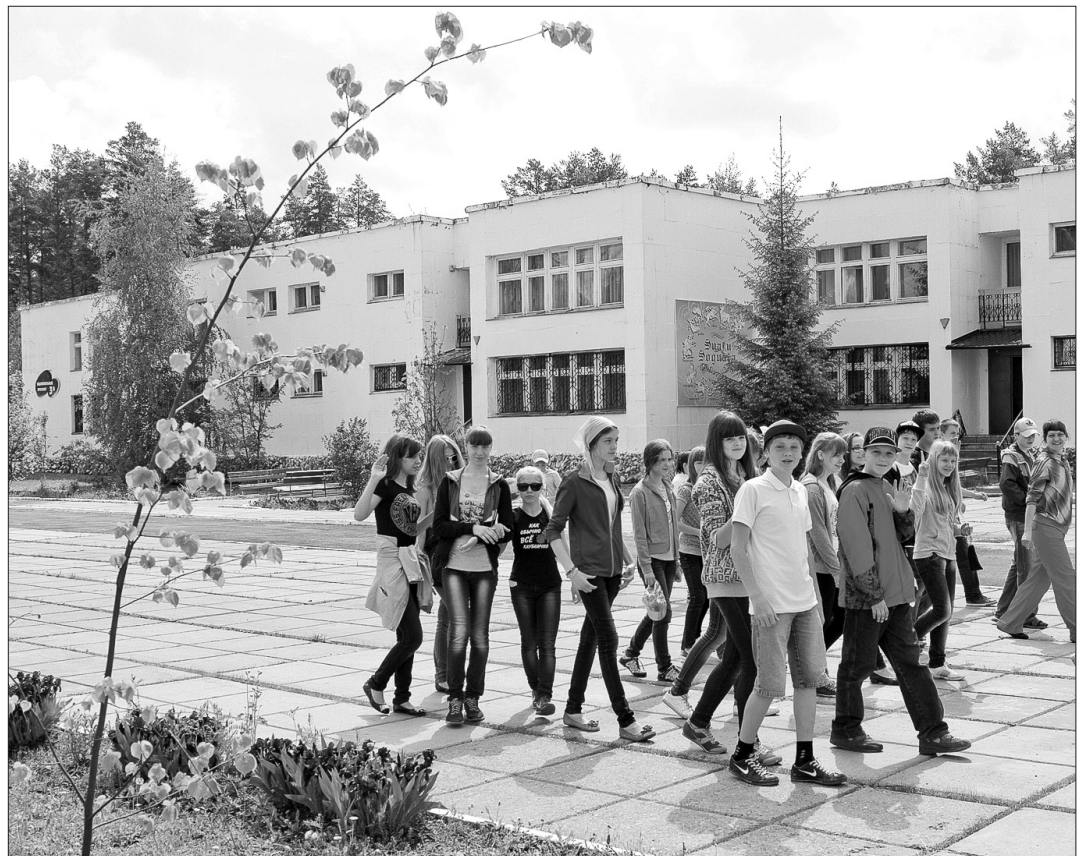
В лагере «Звездный».

В лучшем детском оздоровительном комплексе «Звездный» - чрезвычайные обстоятельства. Дирекция преодолевает их мужественно и методично. Совсем по-другому воспринимают сложившуюся ситуацию родители и родственники детей, отдыхающих там в третью смену. Один из сигналов о ЧП поступил и в редакцию «ТР».