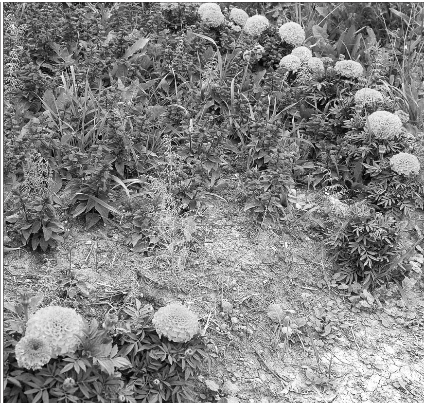
На клумбах зияют проплешины.

«Забота о городе – дело каждого» – так звучит девиз Дня города-2013. К сожалению, далеко не для всех он служит руководством к действию. Некоторые жители, наоборот, словно в знак протеста, наносят Нижнему Тагилу ущерб.