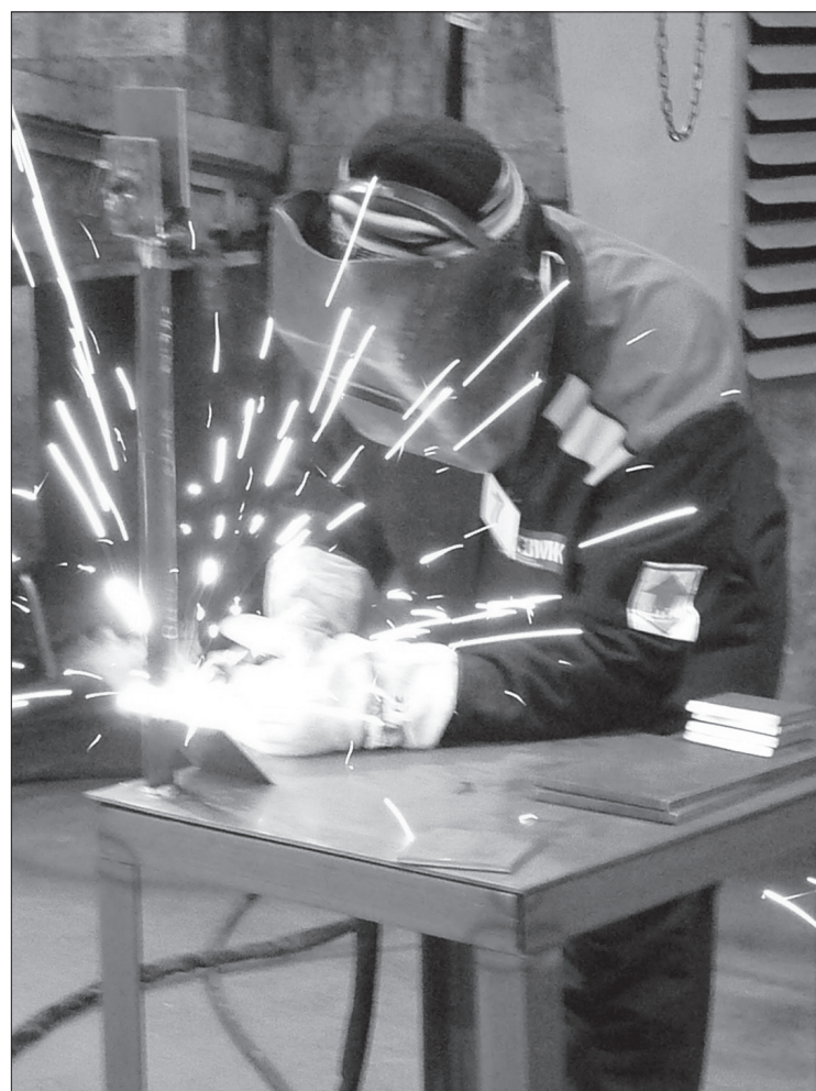
И работа закипела...