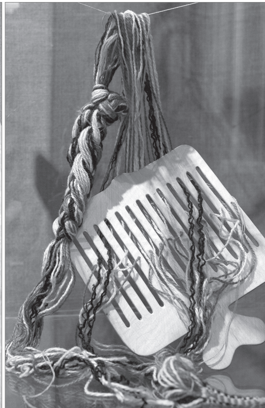
Бердечко деревянное с заправкой нитей для плетения пояса.