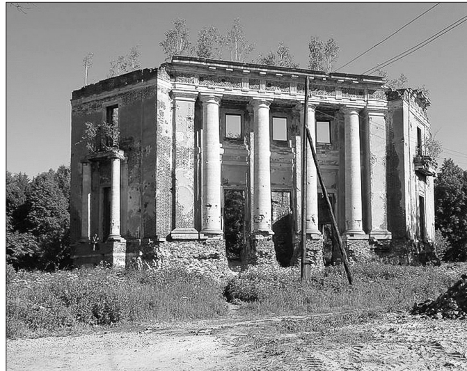
Останки дворца в начале XXI века.