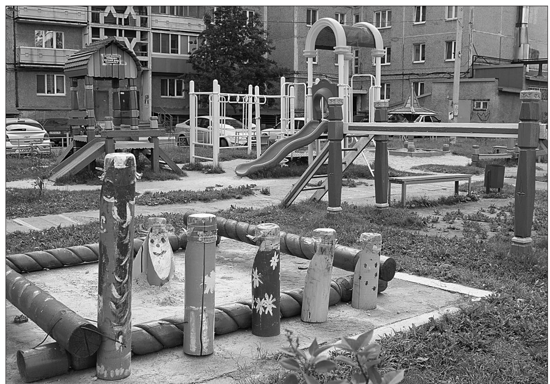
Детская площадка на ул. Космонавтов, 9.

Анастасия ВАСИЛЬВА.