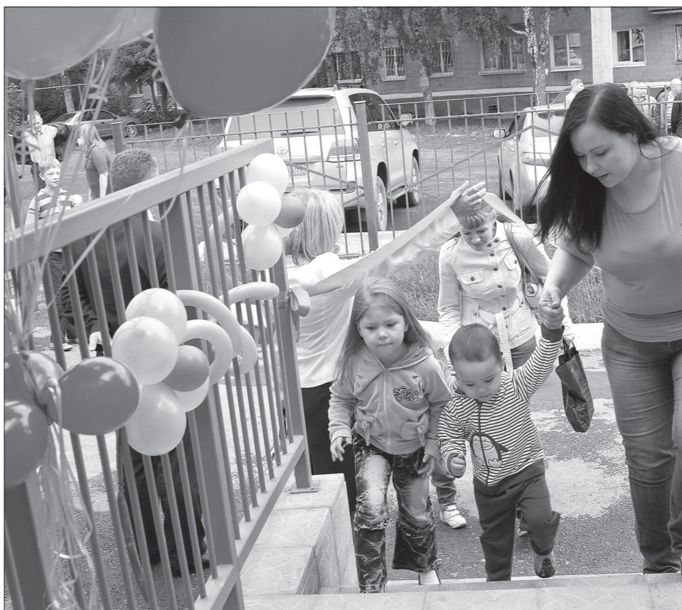
В новый садик с радостью!

Яркие цвета сайдинга, которым обшито здание детского садика №7 под названием «Малыш», словно взяты у солнца и неба. В центре Лебяжки, среди серых пятиэтажек, в канун Дня города повеяло праздником только от одного веселого вида садика. На новоселье раньше удача гостей, среди которых представители всех ветвей власти и строители, пришли маленькие обитатели красивого дома с родителями. Теперь девочки и мальчики Лебяжки будут расти в прекрасном детском садике «Малыш» на ул. Ермака, 43.