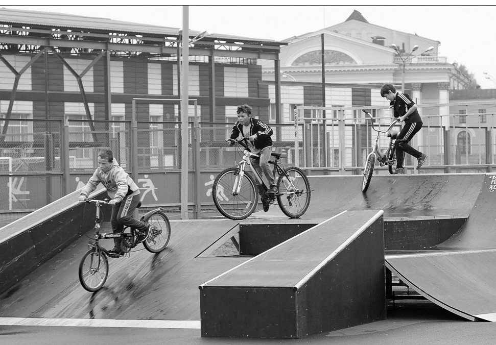
Объект зависти подростков других районов - горки для скейтборда у ДК им. Окунева. Юные велосипедисты штурмуют их в любую погоду.