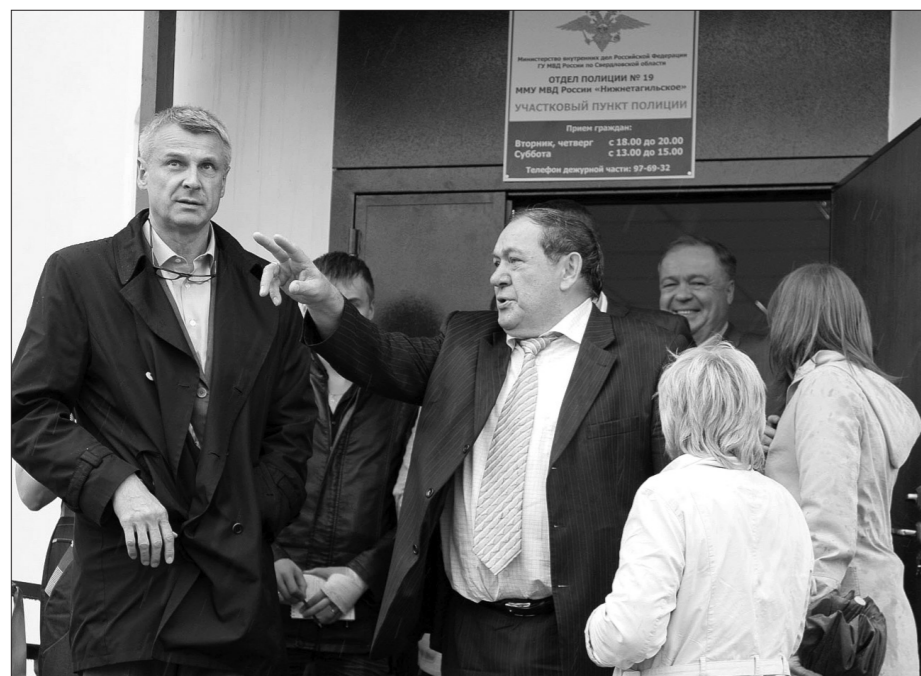
Новый опорный пункт полиции открылся в Техпоселке.