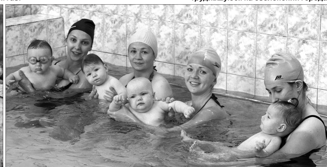
Мамы с малышами укрепляют здоровье в бассейне поликлиники №5.

здесь оборудована уполномоченная площадка для скейтборда. Кататься и тренироваться можно свободно и бесплатно.