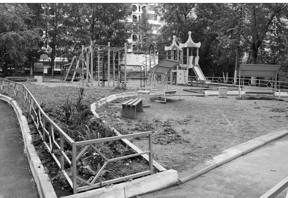
Двор на улице Максарева - пример того, как при желании и согласии собственников территорию можно благоустроить лучше, чем это делалось по программе «1000 дворов».