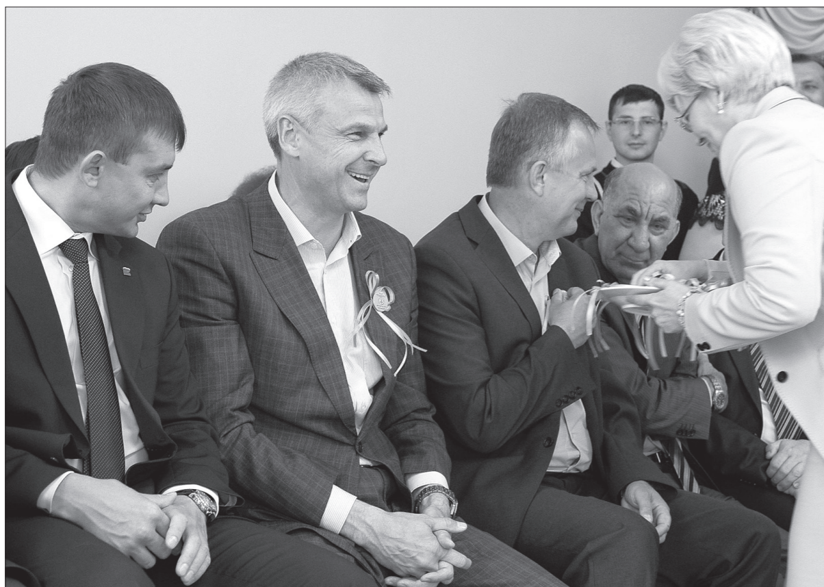
Почетные гости праздника.