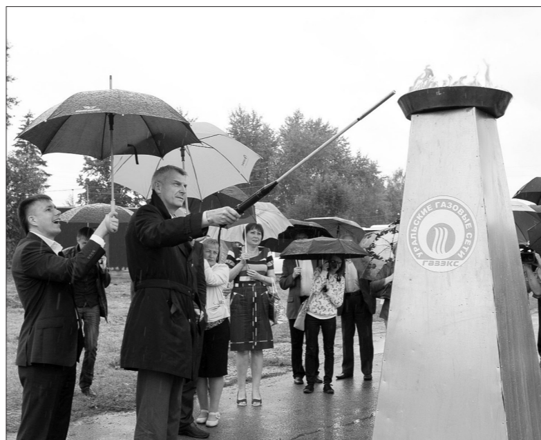
Факел зажжен - на Голом Камне появился газ!