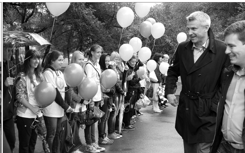
В Комсомольском сквере глава города приветствует молодежь, трудившуюся на озеленении города.