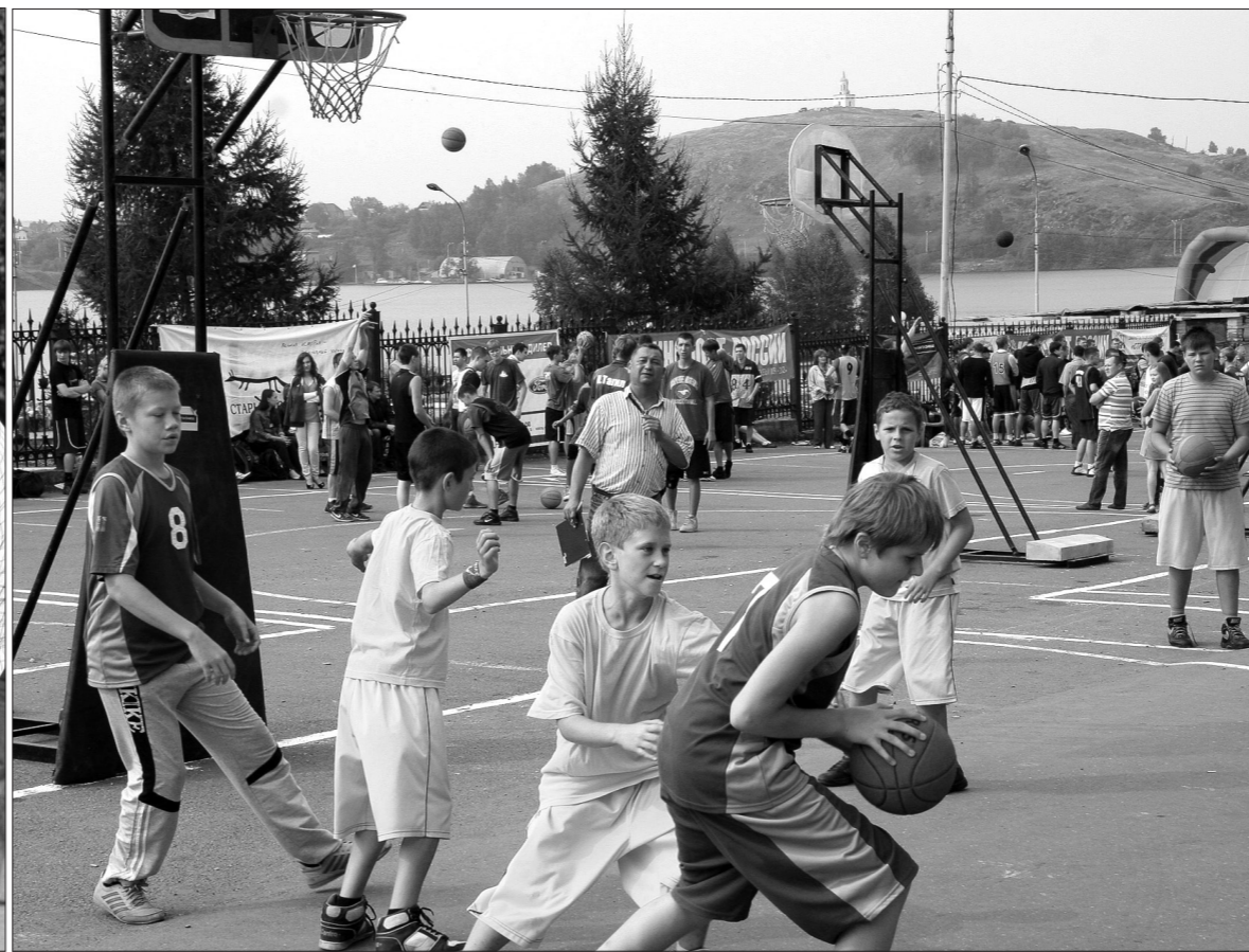
Тагильский стритбол - на фоне Лисьей горы.

178 команд участвовали в XIV чемпионате города по стритболу, который прошел в минувшие субботу и воскресенье на площадке перед администрацией Ленинского района. Кстати, эту площадку, откуда открывается живописный вид на пруд, Лисью гору и колесо обозрения в парке имени Бондина, баскетбольный клуб «Старый соболь» и одноименная ДЮСШ - зачинщики и организаторы наших стритбольных турниров, славящихся на всю Россию, несколько лет назад уже опробовали при проведении всероссийского «Оранжевого мяча».