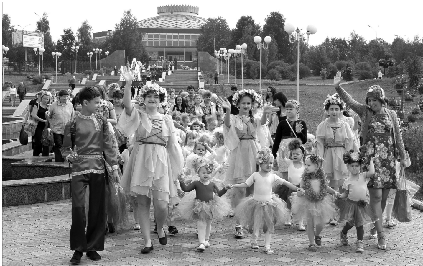
«Цветочный ручеек» участников праздника.