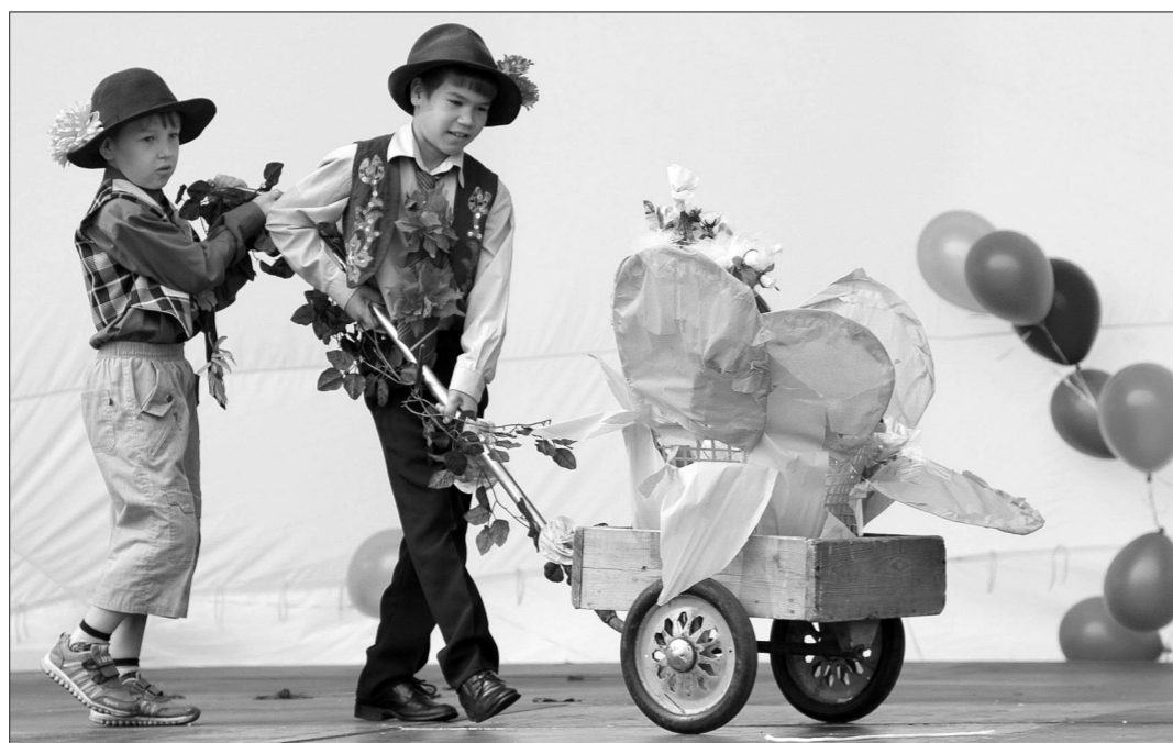
Юные актеры из школы №1 привезли Дюймовочку.

При изготовлении костюмов тагильчане использовали самые разнообразные ткани: органзу, габардин, сатин, атлас, тюль... Не бо-