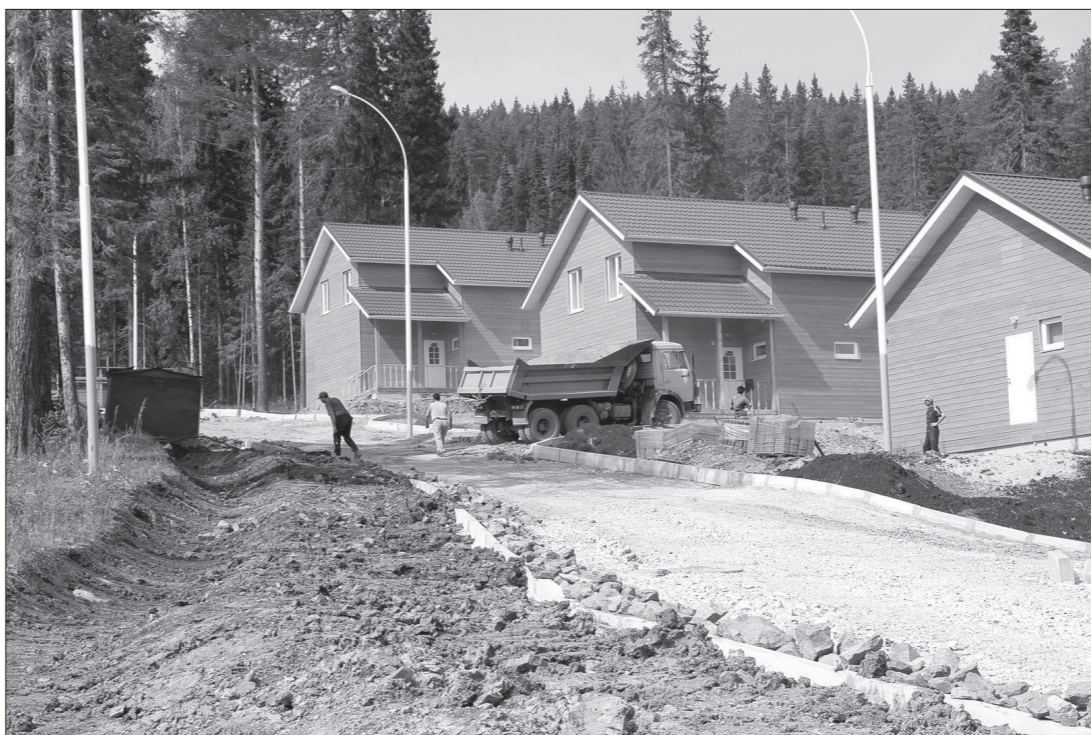
... а дорога к месту соревнований по-прежнему выглядит неприглядно.

С 13 по 15 сентября в Нижнем Тагиле впервые в истории пройдет этап летнего Гран-при по прыжкам на лыжах с трамплина. До начала этих престижных международных соревнований осталось меньше месяца, однако на Долгой, где, казалось бы, должна кипеть работа, изменений к лучшему не заметно. Комплекс «Аист» по-прежнему больше похож на стройку, нежели на место состязаний элитных летающих лыжников.