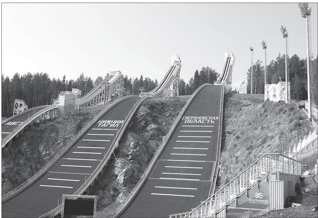
Трамплины к Гран-при готовы...