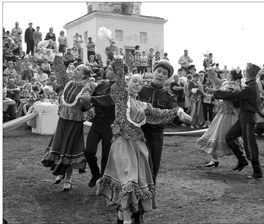
Выступление хореографического ансамбля «Родничок» на Лисьей горе.