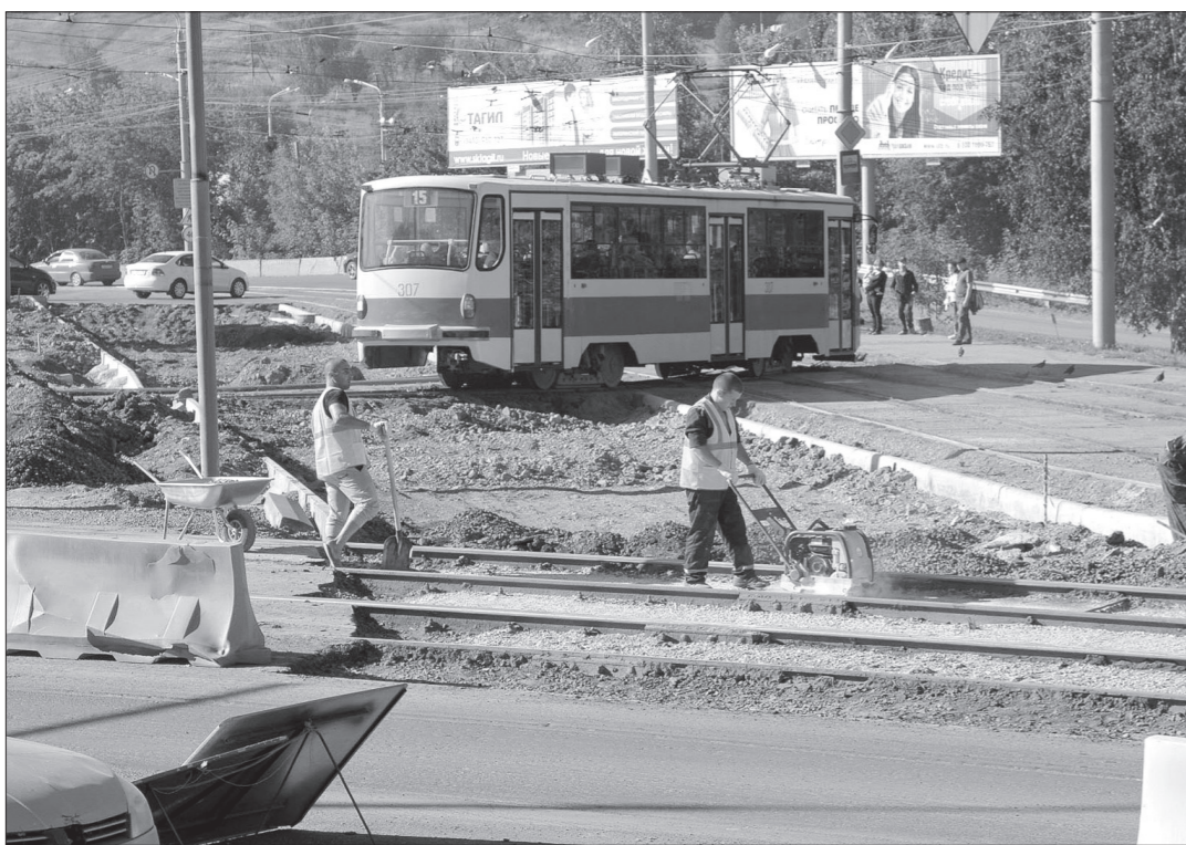
Работы не мешают движению трамваев.