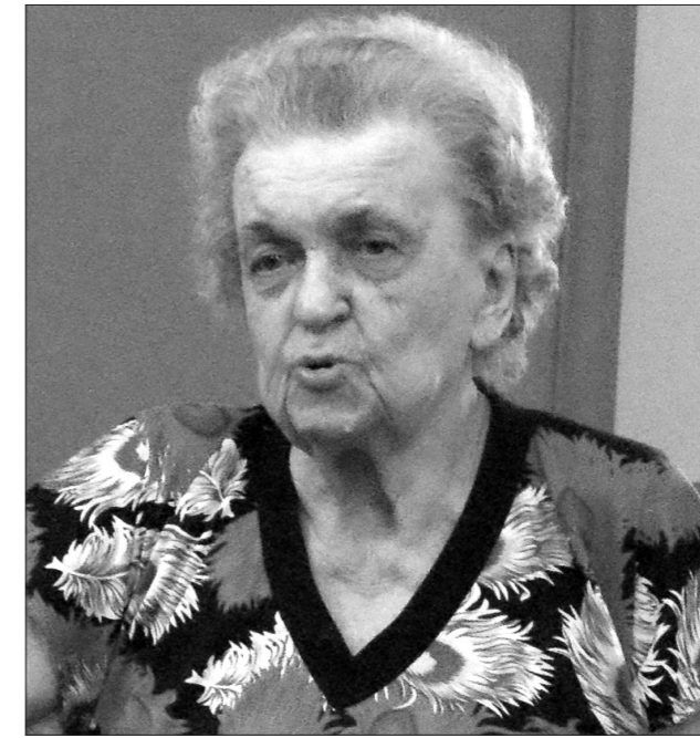
Профессор Ангелина Константиновна Гуськова на встрече с общественностью города.

Многие земляки знают, что она - врач в четвертом поколении, автор 200 научных публикаций. Общезвестным стало участие А.К. Гуськовой в лечении облученных на заводе «Маяк», моряков подводной лодки К-19 и пострадавших в результате чернобыльской аварии. Ее называют первым человеком, научившимся побеждать лучевую болезнь. Но мало кто слышал, что сама Ангелина Константиновна когда-то получила дозу в 200 рентген.