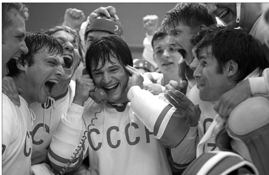
Кадр из фильма «Легенда №17».

В «Красногвардейце» всех поклонников российского кино ждут сначала в четверг, 29 августа, на заседании клуба «Киногурман»: тагильчане увидят фильм Михаила Калика «Любить». Напомним, что картина была снята в 1968 году, роли в ней исполнили Игорь Кваша, Екатерина Васильева, Алиса Фрейндлих, Андрей Миронов, Сергей Гурзо, Светлана Светличная, а еще здесь есть документальные кадры с размышлениями о том, что такое любовь. 12 сентября начнется де-