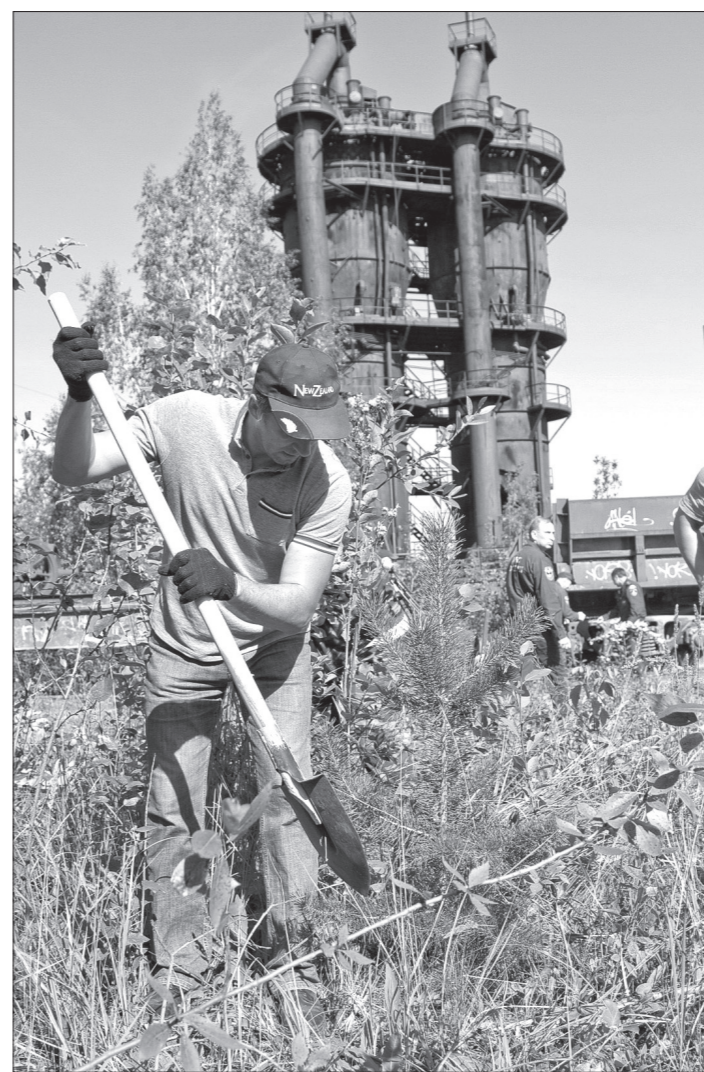
Благоустройство территории завода-музея.