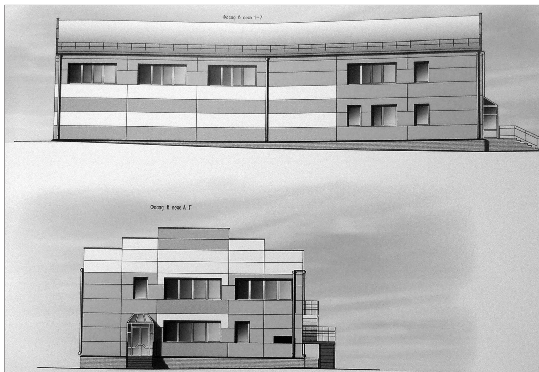
Проект спортивного комплекса для школы №56.

так как там интенсивное движение, которое может угрожать школьникам, переходящим в этом месте дорогу. К тому же в весеннее время невозможно ходить по тротуару вдоль улицы Черноморской - разбит асфальт, повсюду лужи, и детям приходится передвигаться по проезжей части.