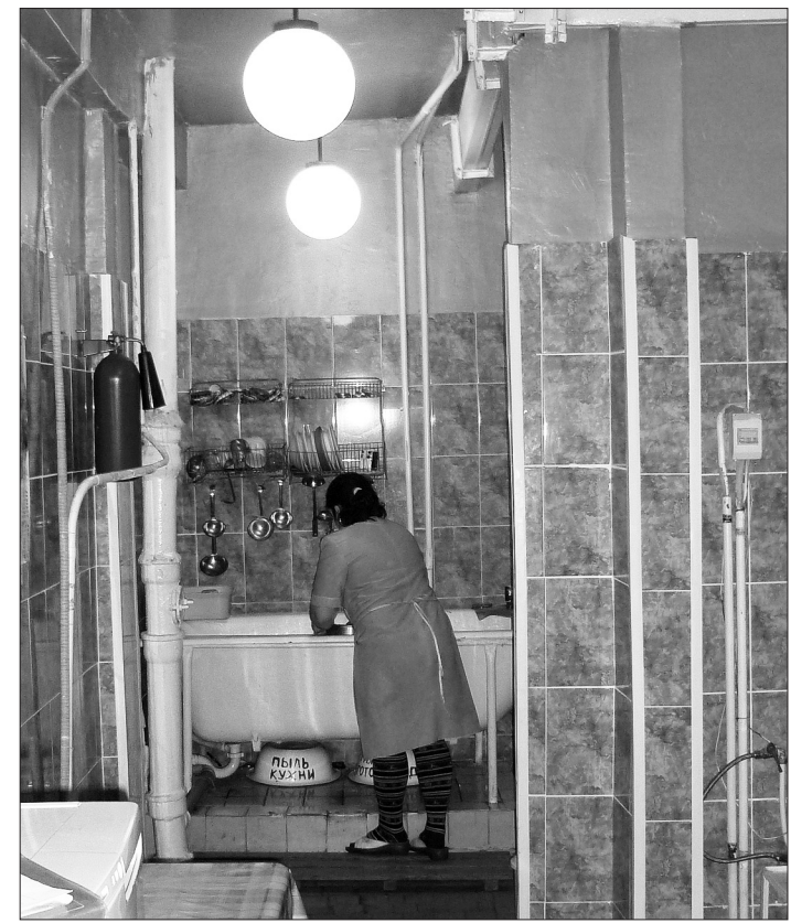
В детском саду №133 на деньги «депутатского миллиона» отремонтирован пищеблок.