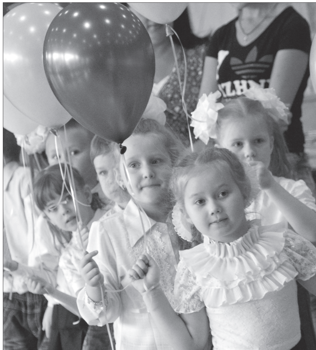
Участников августовского педсовета приветствуют дети.

Многое сделано, чтобы привести систему в соответствие с федеральными стандартами. За год введены два детских сада, строятся еще пять. Перемены коснулись разных образовательных уч-