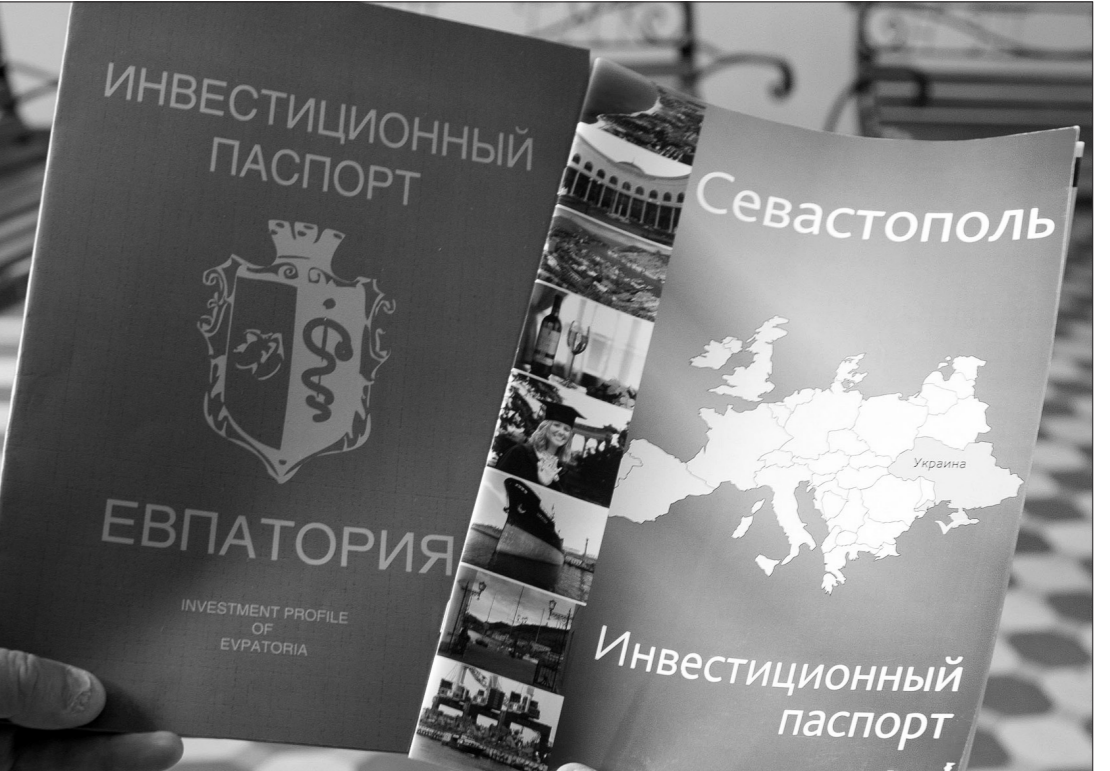
Инвестиционные паспорта крымских городов.

нично-офисных центров, реконструкции ветхого жилого фонда, возведении новых жилых и гостиничных комплексов на берегу Черного моря. Город нуждается в дальнейшем развитии морского, яхтенного, зеленого, паломнического, военного и винного туризма. Инвесторам предлагаются для покупки готовые, не завершённые строительством