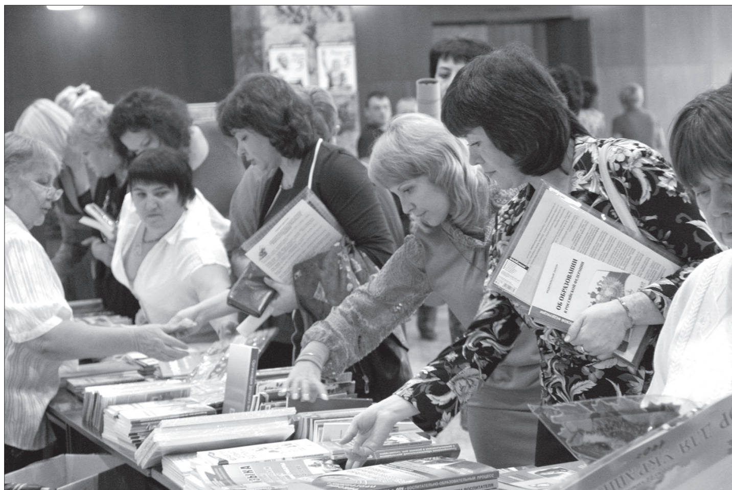
Учитель всегда тянется к книге.