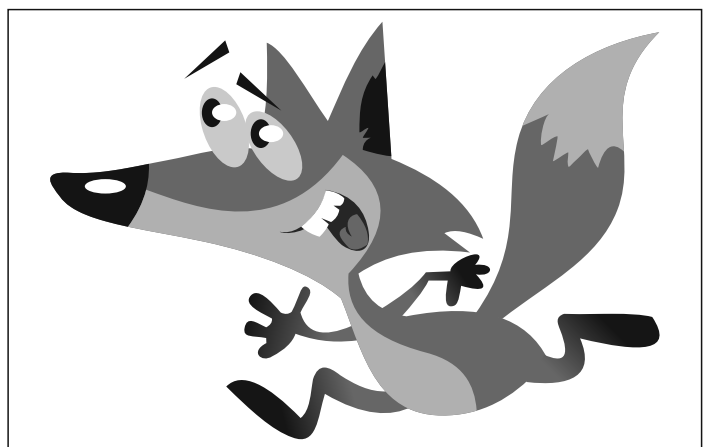
иллюстрация ПЕТРА УПОРОВА.

Леон Смит нашел незваную гостью в своей кровати утром, когда почувствовал прикосновение. Смит тут же проснулся и увидел, что на его кровати сидит небольшая лиса. Всего лиса пробыла дома у лондонца около десяти минут. Смит выгнал