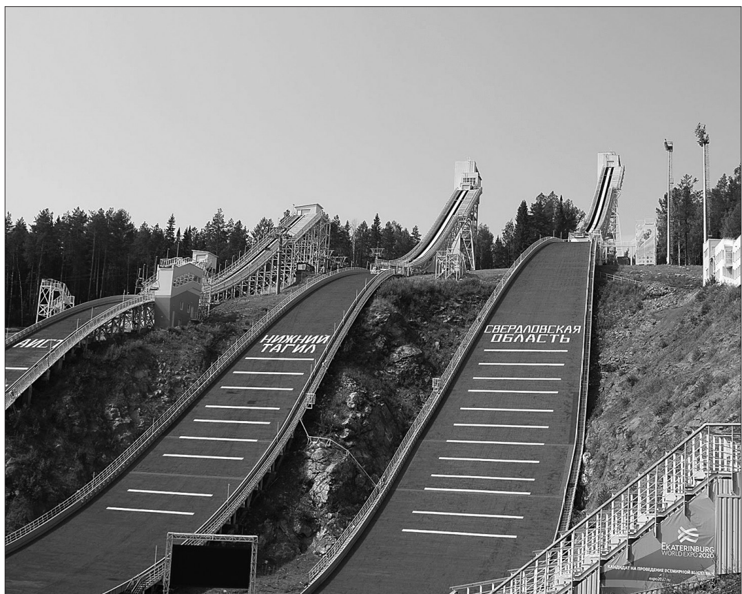
Тагильские трамплины.

На этапе летнего Гран-при по прыжкам на лыжах с трамплина, который состоится в Нижнем Тагиле с 13 по 15 сентября, мужская сборная России выступит сильнейшим составом.