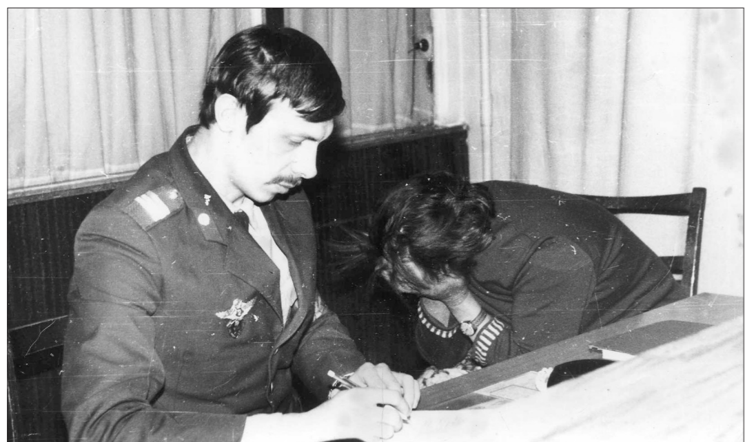
Рабочие будни.