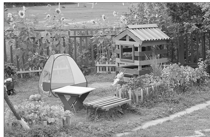
Здесь малыши играют.