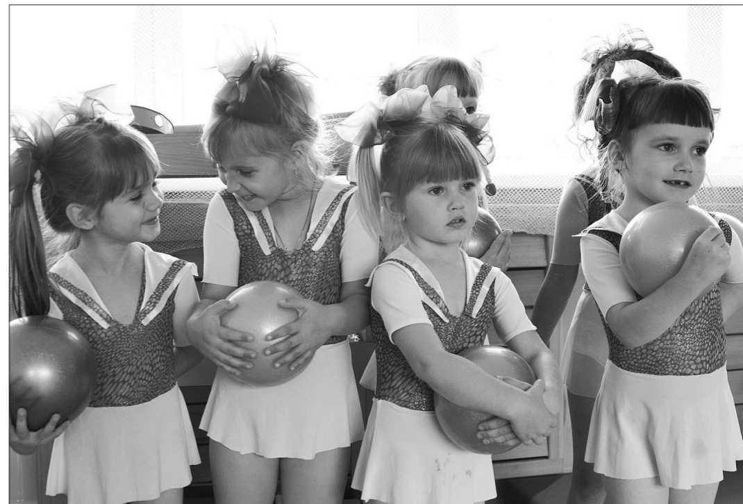
Юные грации из «Маячка».

Для второклассников 17 часов обучения плаванию стало уже нормой. Плавание