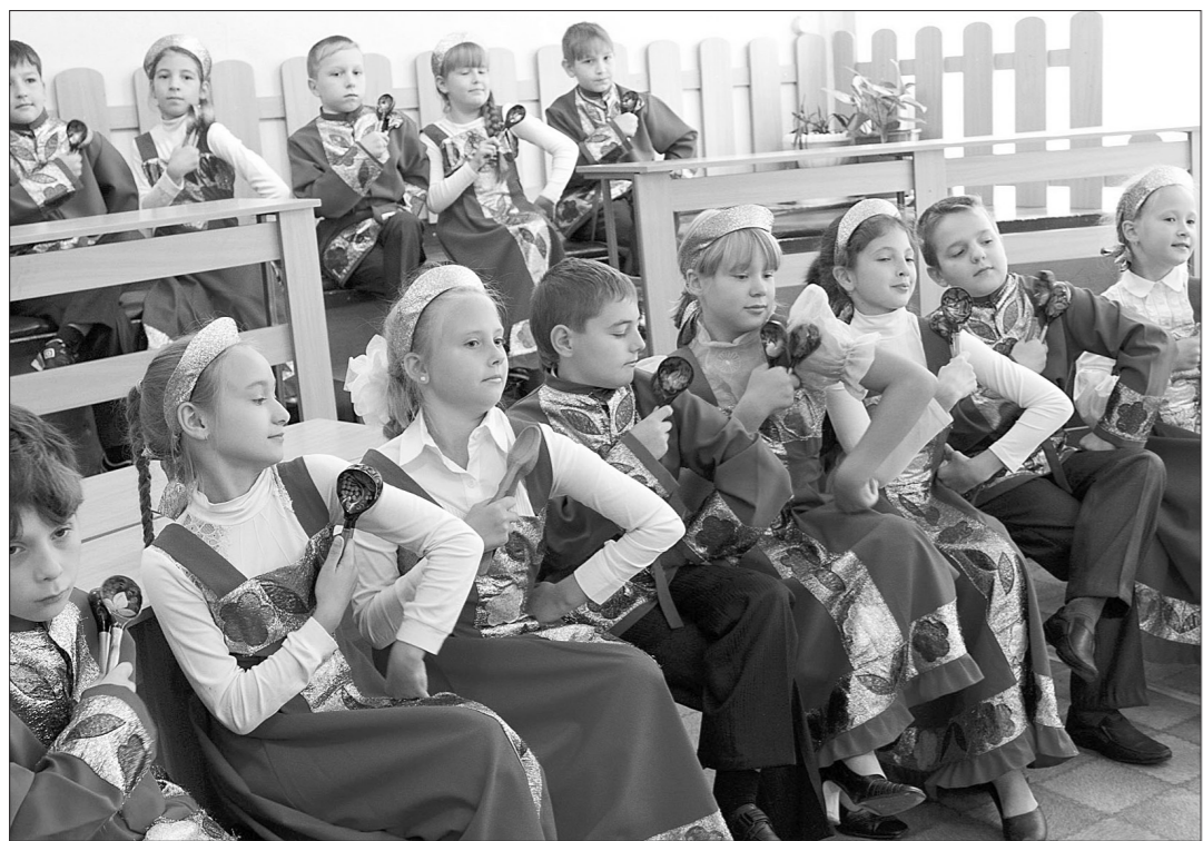
Ансамбль локкарей лицея.