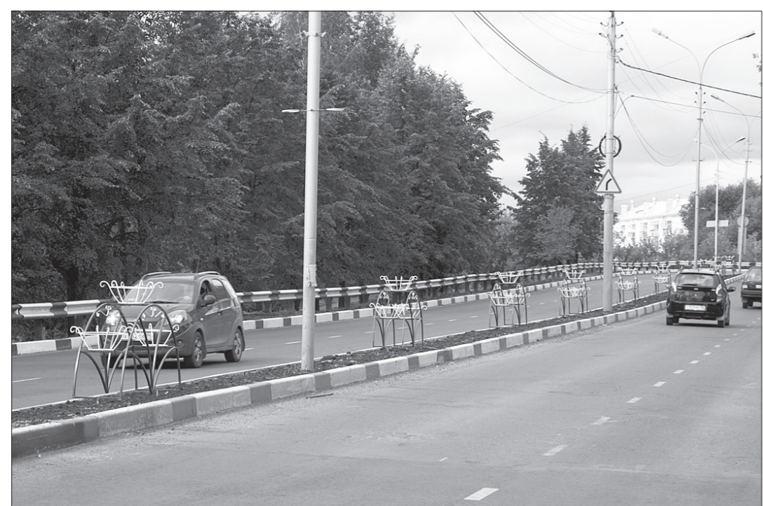
На дороге по улице Горошников Тагилдорстрой установил новые металлические конструкции для цветов - в сентябре город станет еще краше.