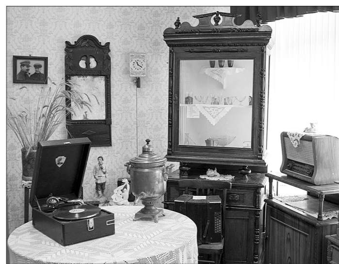
Музей быта покорил всех участников тура.

данные ранее той или иной организации. Помимо этого контрольные мероприятия выполняются по поручениям Президента или правительства Российской Федерации и в рамках надзорных мероприятий, проводимых органами прокуратуры.