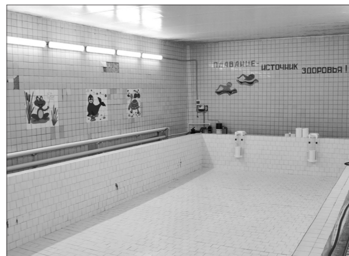
Бассейн школы №30 готов к началу учебного года.