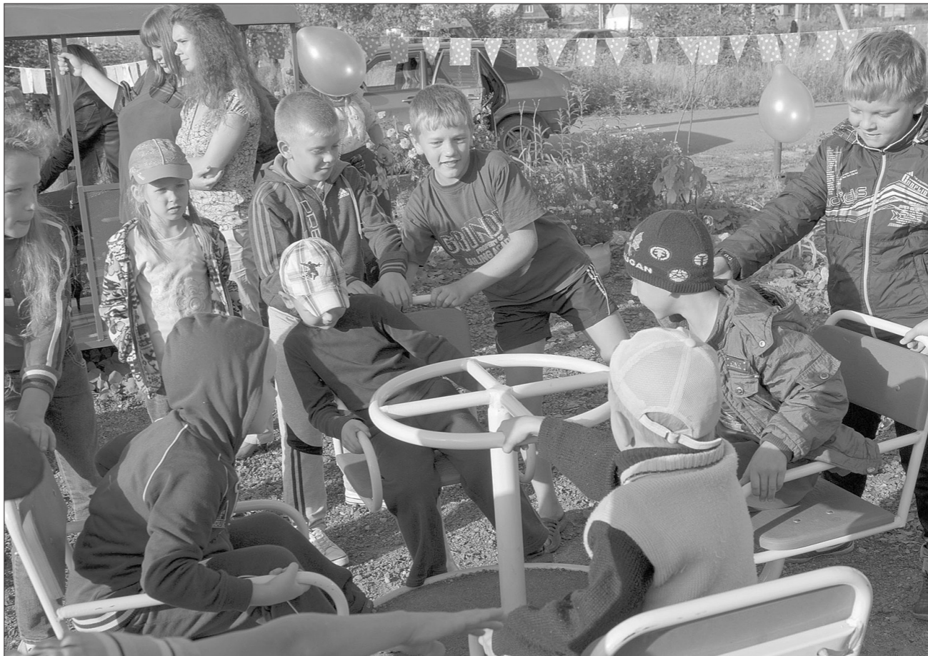
Площадку ТОС «Звездный» начал строить в прошлом году, а этим летом благодаря субсидии городского бюджета ее полностью оборудовали для ребячьих игр.

мощью благотворителей – по магазинам микрорайона собрал 6,5 тысячи на это мероприятие.