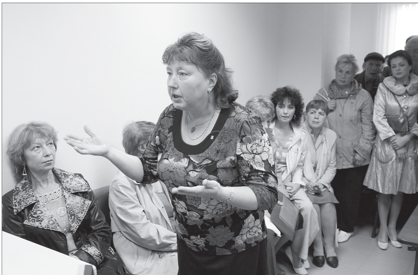
Один за другим жители приводили доводы против «двоевластия», фактически установившегося в управлении домами.

5 сентября состоялась встреча актива собственников двух многоквартирных домов на улице Юности, 22 и 24, с руководителями администрации города. Два этих дома захоронились с новой силой, но на старой почве - спора между двумя УК.