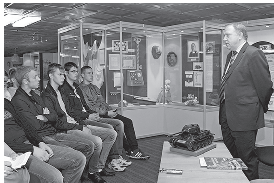
Встреча в музее истории Уралвагонзавода.

На Уралвагонзаводе прошли праздничные мероприятия в честь Дня танкиста. Чествовали заводчан, ветеранов отрасли, участников локальных конфликтов.