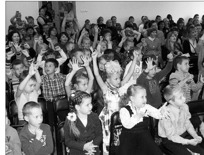
На веселом празднике в канун Дня знаний.

Праздник, посвященный Дню знаний, прошел увлекательно и интересно. Ребята получили большой эмоциональный заряд и красочные наборы школьных принадлежностей. Каждому первокласснику вручили билеты в парк им. Бондина на посещение аттракционов.