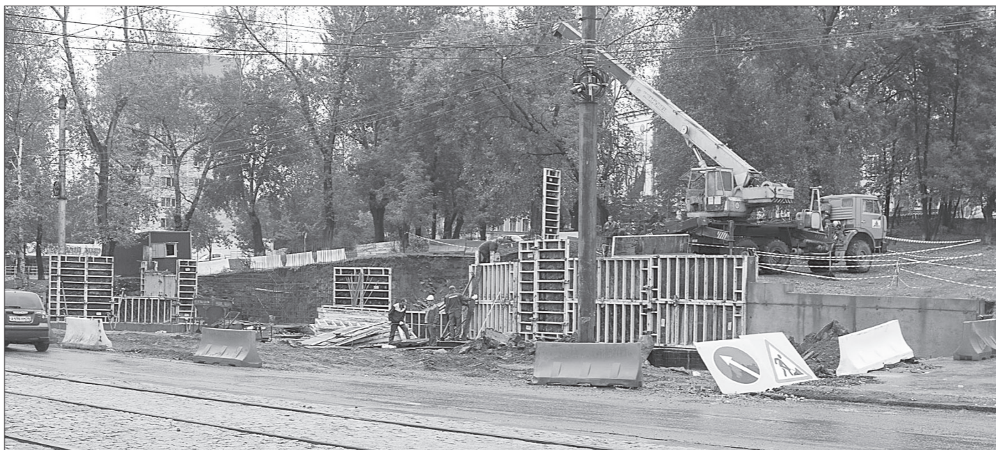
На этом месте скоро появится остановочный комплекс.

новой развязке. Дорожные работы практически завершены. Дело за переносом остановочного комплекса. Летом была подготовлена площадка. Поскольку место для нее выбрано на возвышении, рабочие прокопали землю на метр, а затем пробурили массив скалы еще на три метра. Чтобы грунт не падал, возводится подпорная стена из бетона. Задача ООО «Уралстроймонтаж» - до конца неде-