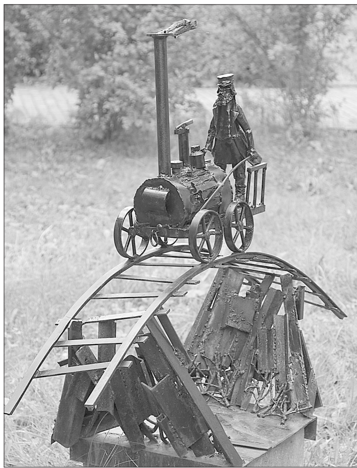
«Черепанов на паровозе». Автор скульптуры А. Брусницын.

Людмила ПОГОДИНА.