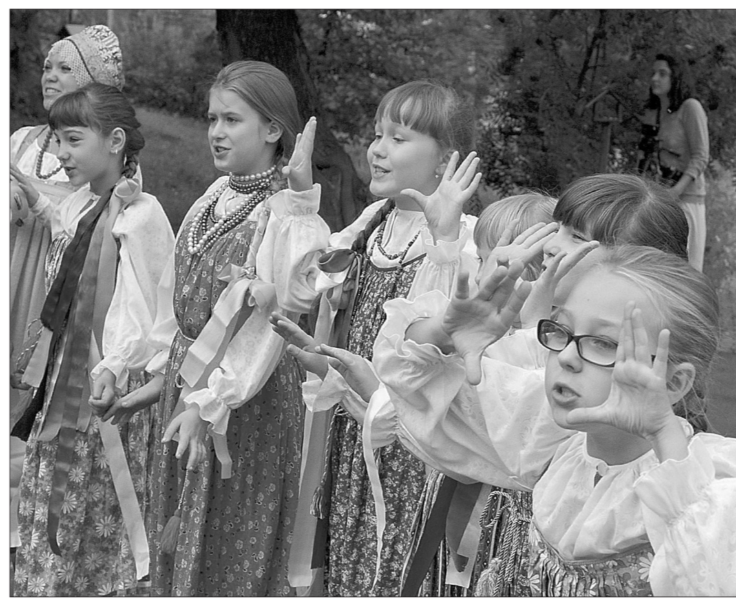
Воспитанницы солисток ансамбля «Соловейко» подготовили концерт.