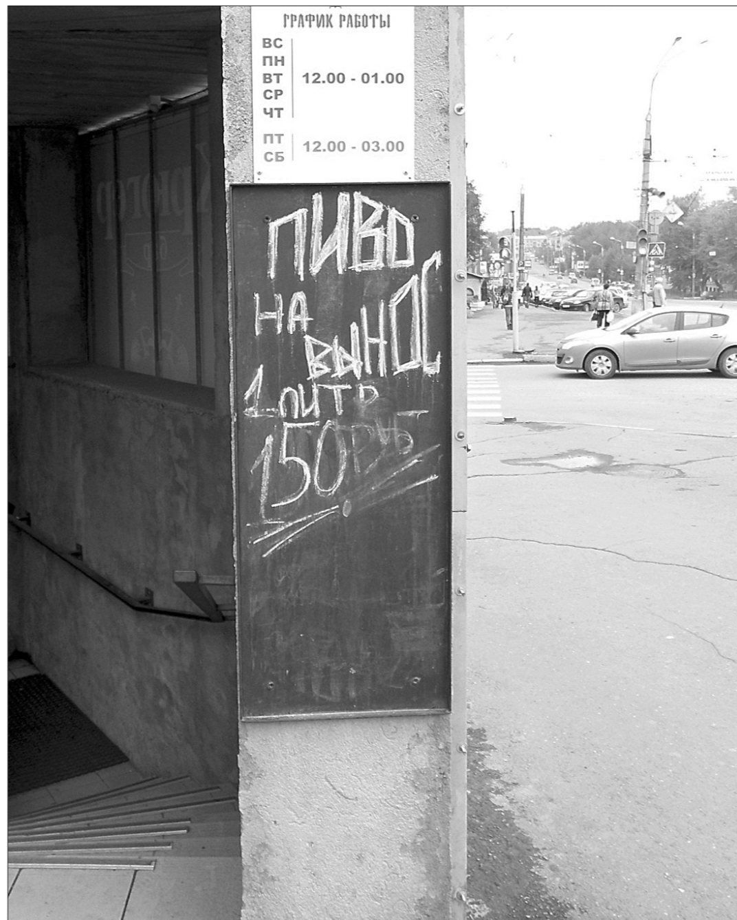
Две цены - и в два часа ночи пиво ваше...

Тем не менее, примерно такую же схему используют некоторые службы доставки, визитки которых можно получить, к примеру, от так-