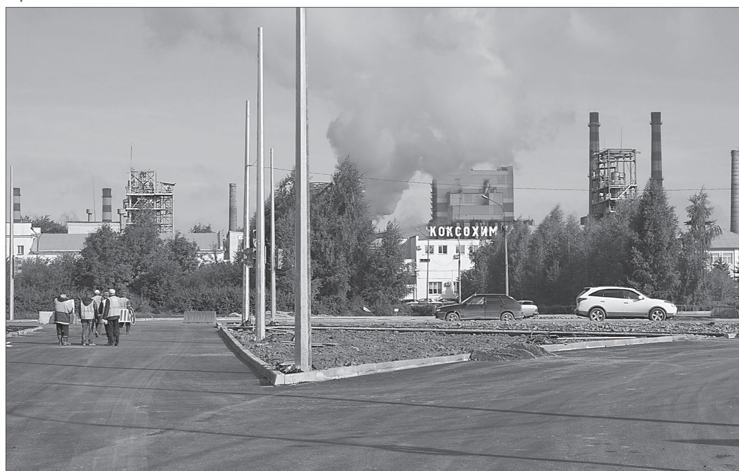
Асфальтирование проезжей части завершено.