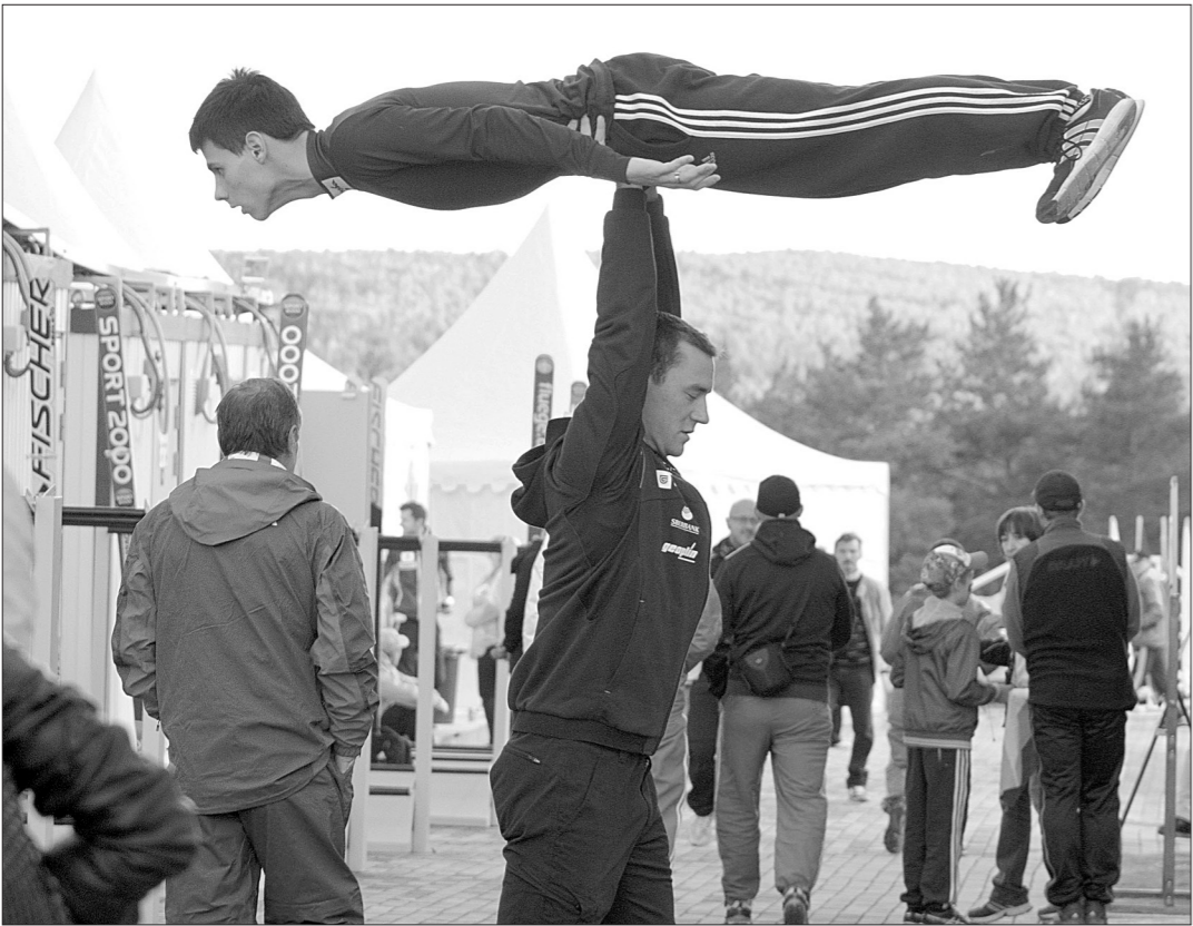
Тренировка перед стартом.