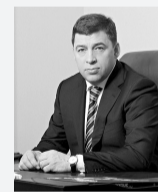
Губернатор Свердловской области Евгений Куйвашев :

«Времени до начала отопительного сезона осталось совсем мало. Мы не можем себе позволить оставить людей без тепла. Работа проделана большая, большинство муниципалитетов готово к зиме, но еще остаются проблемы, которые необходимо устранить в самый короткий срок».