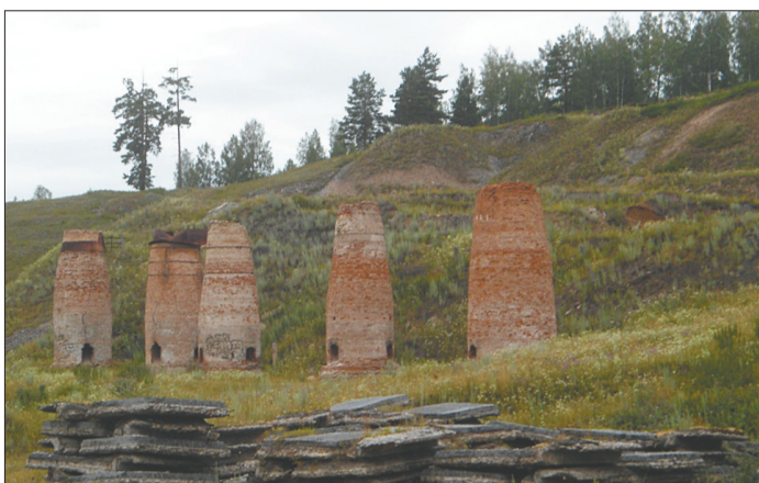
Старинные печи на границе с Башкирией.