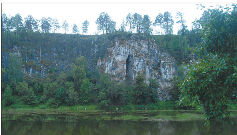
Притесы на реке Ай.