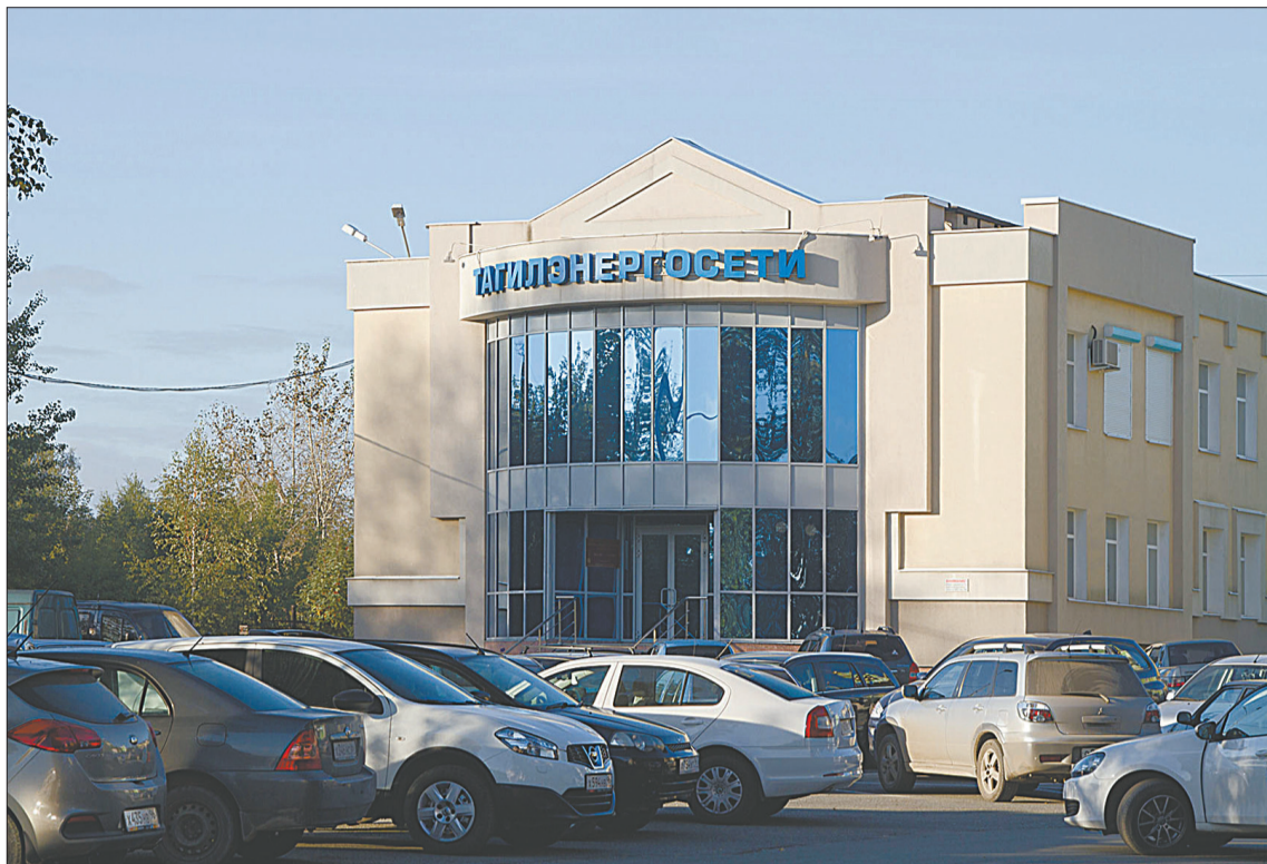
Возле офиса субподрядчика.

железобетонных опор освещения, находящихся в аварийном состоянии.